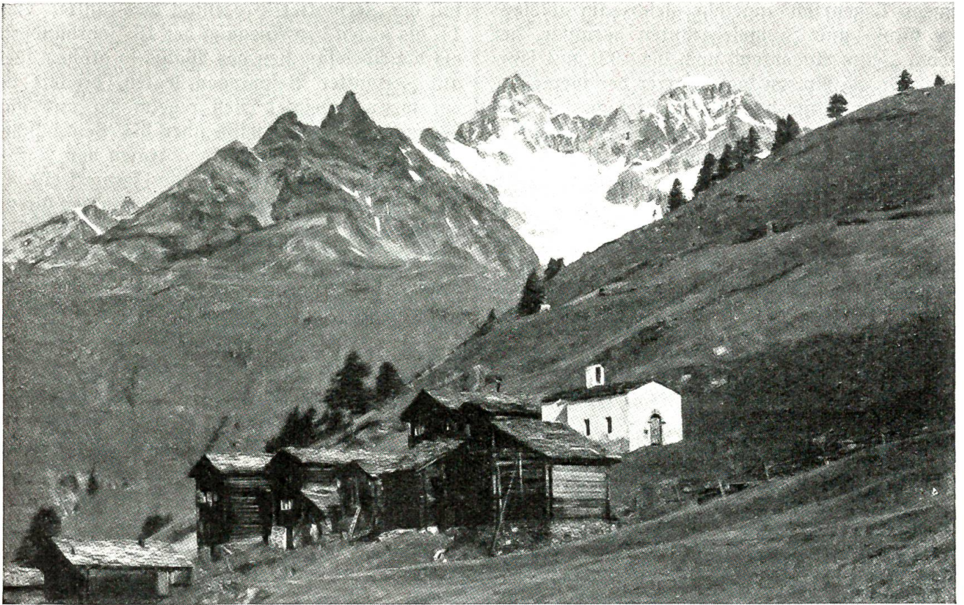
Nr. 6703 BRB 3.10.39