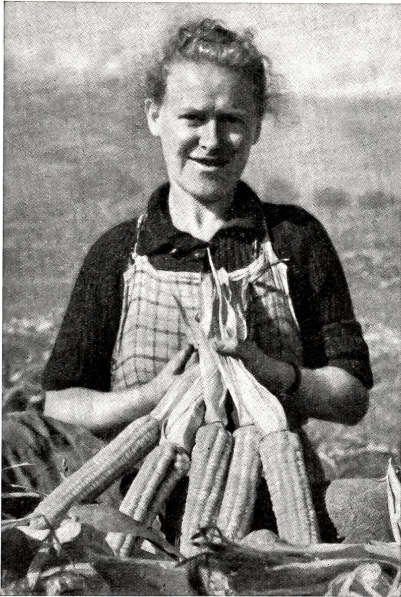
Weisse Maiskolben aus dem Wartauerland.

Ein anderer Mister in London saß in der Dachkammer eines vierstöckigen Hauses und dachte über die schlechten Zeiten im allgemeinen sowie über die ernste Frage im besondern nach, wo er die fällige Wochenmiete von vier Schilling hernehmen sollte. Plötzlich hörte er von unten auf der Straße ein heftiges Krachen. Der junge Mann eilte zum Fenster und schaute, sah aber nur Leute nach einer bestimmten Richtung laufen, da das vorspringende Dach den Schauplatz des Er-