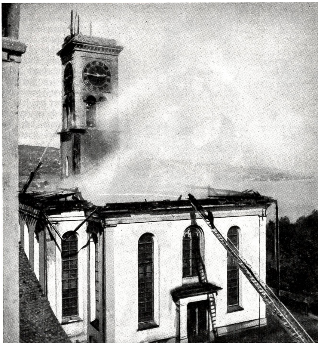
Kirchenbrand in Thalwil. 19. Mai 1943.

er unwillkürlich einen Fuß rasch zur Seite stellte. Dabei trat er aber auf eine Bananenschale, rutschte aus und fiel auf jenen Mann, den er mitriß. Der Mann wieder klammerte sich mit der einen Hand instinktiv an Mr. Clear, während er mit der andern Halt suchte. Dabei erwischte er die Klinke, die Wagentür ging auf, und der Mann, der den andern festhielt, flog mit diesem in kühnem Bogen aus dem fahrenden Zug. Der Sturz war sicher keine erfreuliche Angelegenheit, aber der vom Regen aufgeweichte Boden milderte den Fall so weit, daß die beiden Männer ohne