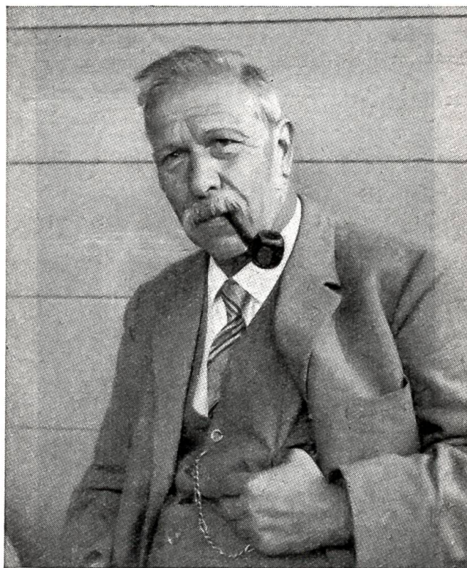
Simon Gfeller, a. Lehrer und Schriftsteller, Bühlslüh. † 8. Januar 1943.