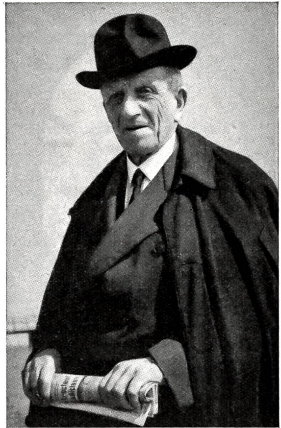
Komponist Gustave Doret, Lutry.