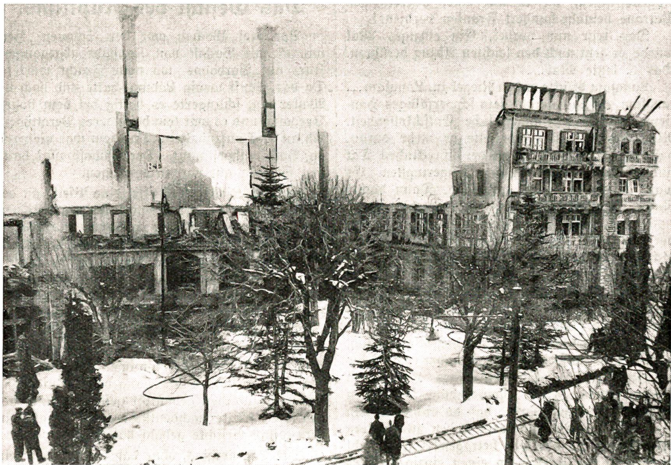
Hotel „Baer“ in Grindelwald niedergebrannt.