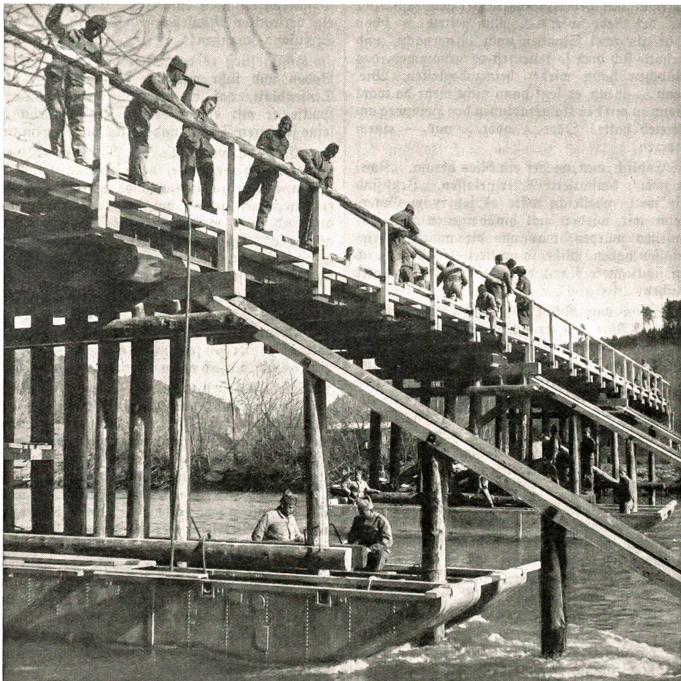
Unsere Truppen beim Brückenbau.

B. Nr. M/F 4601.