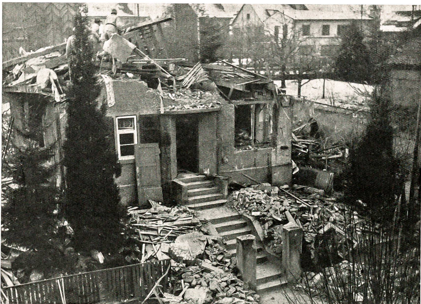
Bombenabwürfe in Basel. In einem Einfamilienhaus gab es drei Todesopfer. Großmutter, Mutter und ein achtfähriges Töchterchen konnten nur noch als Leichen geborgen werden.