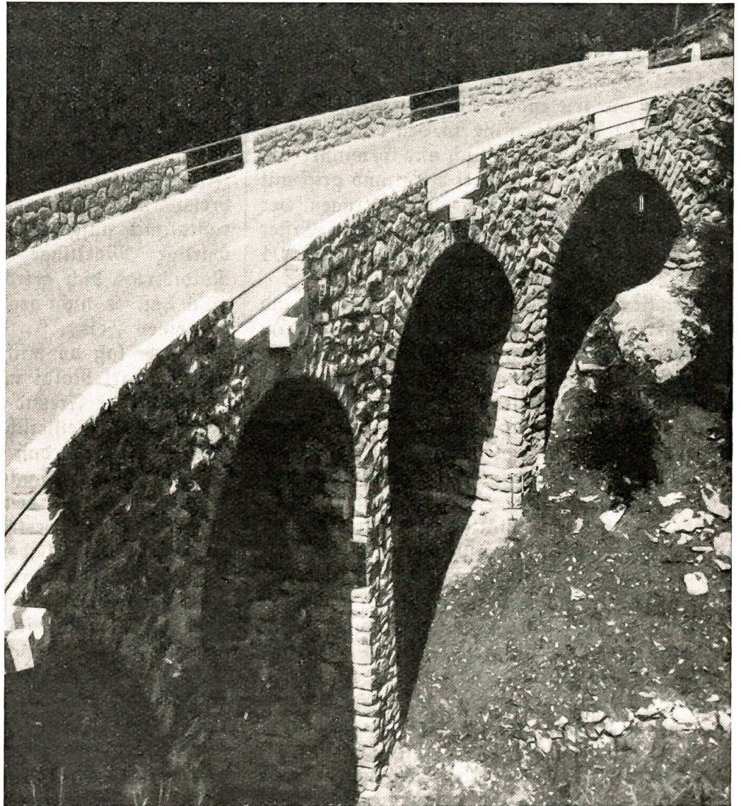
Bau der Sustenstraße.

Langsam versorgte Noldi das Büchlein in der Kitteltasche. Und, aufschauend, begegnete sein Blick plötzlich demjenigen des Huber Franz. „Aber gelt, dich habe ich gebodigt“, triumphierten überlegen Noldis Augen. „Vor der Nase weggeschnappt habe ich dir den Bänz — und die Ehre als Ersten damit.“