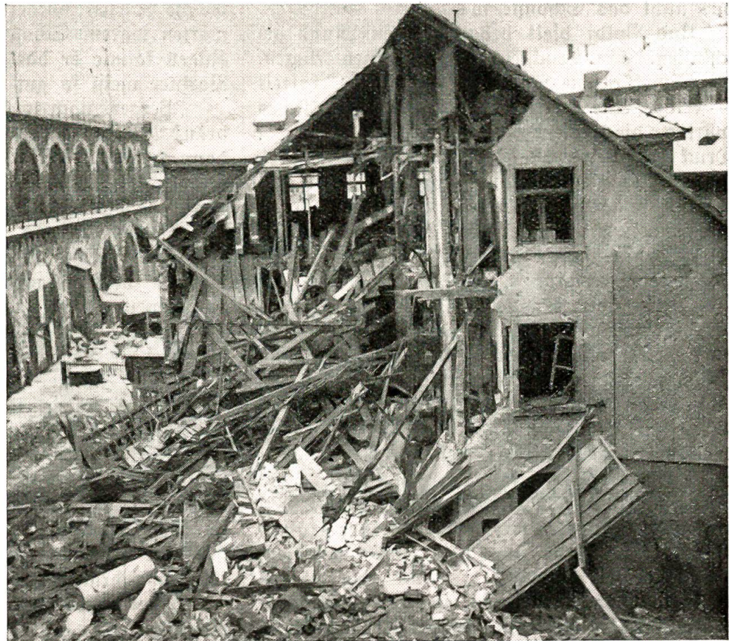
Bombenabwürfe in Zürich. Ein Hinterhaus an der Josefststraße wurde durch eine Bombe schwer beschädigt. B. Nr. VI Br. 6618.