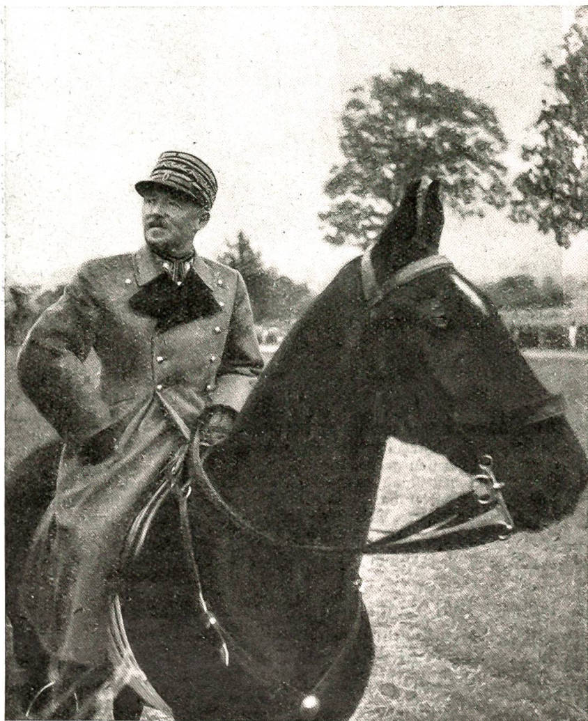
General Guisan beim Defilee einer leichten Division.

Der Bursche ließ die Schwurhand sinken. Mit ernstesten Worten verwies der Vorsitzende des Gerichts dem Mädchen die Ungebühr vor den Schranken des Gerichtshofes, dann aber wandte er sich an den jungen Mann und fragte ihn nochmals unter schwerer Strafandrohung, ob er auch wirklich mit gutem Gewissen schwören könne. Trotzig bejahte dieser die Frage. Und so beschwor er denn, daß er nie mit dem Mädchen Gemeinschaft gehabt habe und daß er das Kind nicht als seine Tochter anerkenne. (Eine Geschichte, die sich so oft vor den Schranken des Gerichts wiederholt! Leider Gottes!) — Am andern Morgen fand die Bäuerin und Mutter des jungen Mannes eine Malerei an ihrem Scheunentor: grellrote Flammen, die eine Schwurhand umzüngelten. Mit wortreicher Entrüstung beklagte sich die Bäuerin bei ihren Bekannten über diesen Streich. Sie erhielt nur Schweigen als Antwort. Das ganze Dorf hatte Partei gegen sie genommen. Alle ordentlichen Burschen hielten sich von ihrem Sohn fern. Er bekam schlechten Verkehr. Als ihm seine Mutter eines Tages darüber Vorhalte machte, begehrte er zum erstenmal heftig auf.