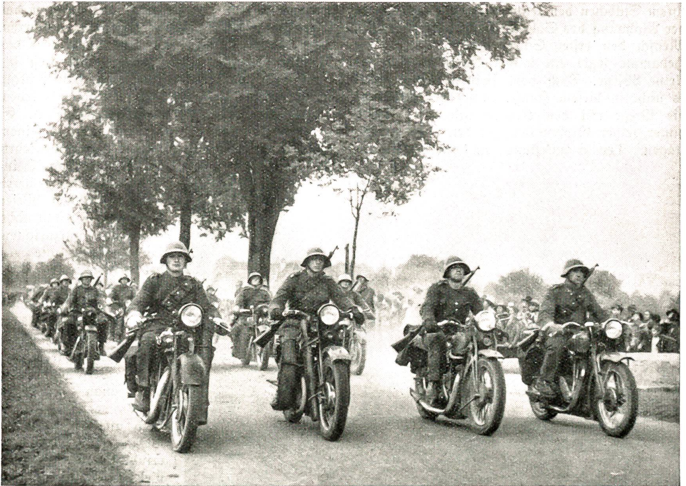
Defilee einer leichten Division.

3. Nr. Gr. III 2862.