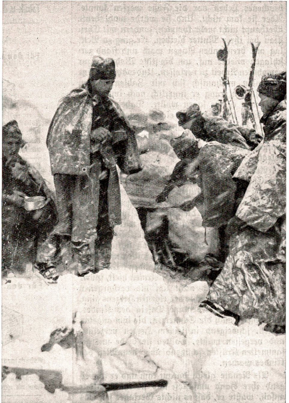
Winterübung, Abkochen bei schlechtem Wetter.

Er saß lange Zeit wie betäubt und überlegte, was nun zu tun sei; in diesen Briefen stand auch sein Schicksal. Löschen sie nicht alles aus, was er jahrelang sein Glück genannt hatte? Er saß