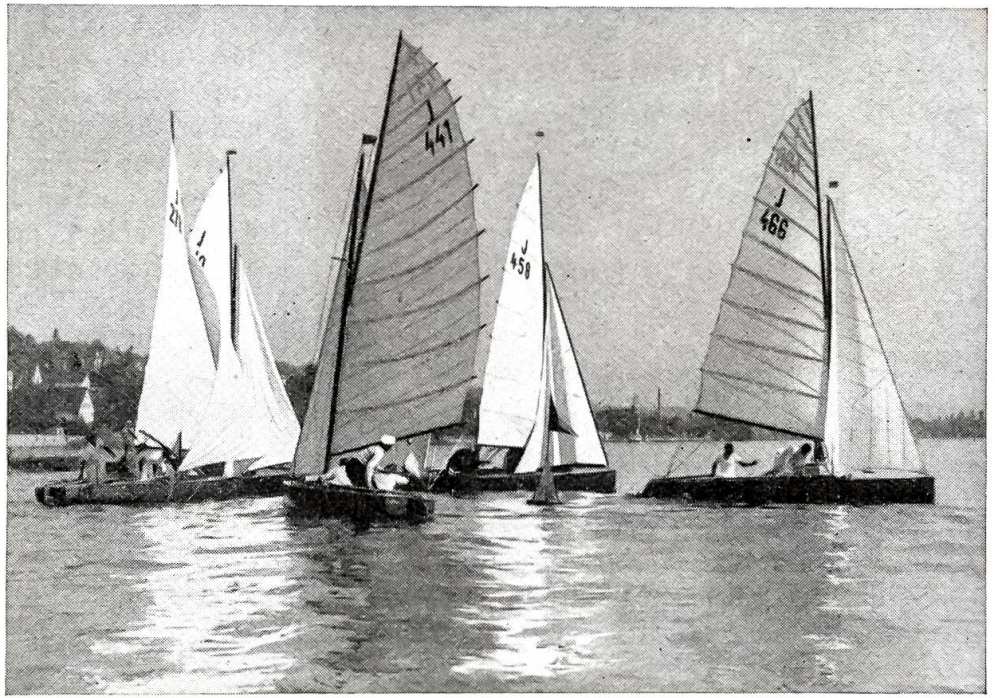
Europameisterschaften im Segeln auf dem Zürichsee.

Er sah mich an wie einen tückischen Zerstörer seines ehelichen Glücks und erklärte heiser vor Zorn: "Ich denke ja gar nicht daran. Glaubst du wirklich, ich lasse mich auf diese Weise kaltstellen? Nein, mein Lieber, da kennst du mich flach!"