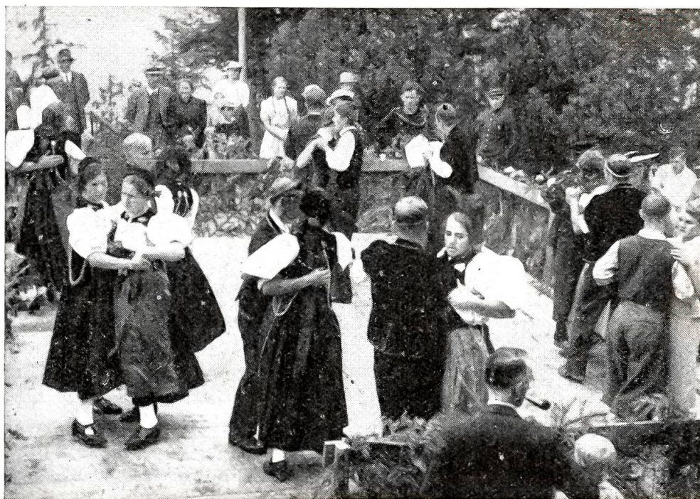
Trachtenschilbi auf Harder-Kulm im August 1937.