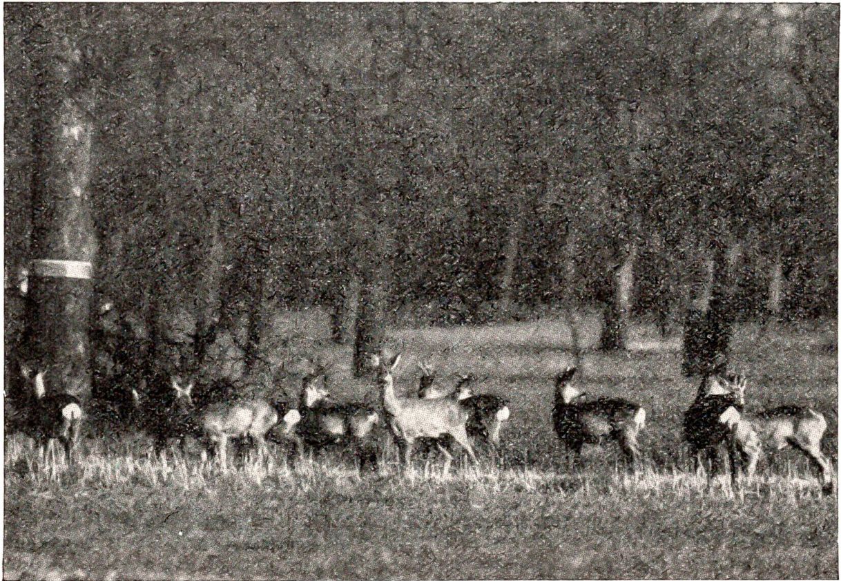
Jedes Tier strebt zu dem seiner Art entsprechenden Verband.

ihnen Unrecht. Denn das Gesicht unserer Heimat hat sich in allen Jahrhunderten nicht so stark und tiefgreifend verändert, als wie seit dem Beginn des letzten Jahrhunderts. Die Erzeugung der Landwirtschaft, die Industriearbeit und ihre Lebensgestaltung, Handel und Verkehr haben gegen früheres Bauerntum, Handwerk und Kaufmannsstand Veränderungen hinter sich, daß