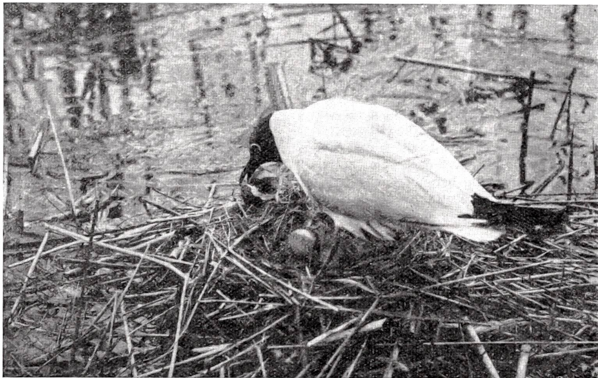
Lachmövenweibchen entfernt die Eierschale.

den es stiftet, gar nicht zu verkennen. Als 1875 das erste Gesetz über Jagd und Vogelschutz in Kraft trat, hat es nichts Geringeres bewirkt, als die Rettung unseres Wildes. Denn zuvor hatte die freie Jagd das Bergwild dem Aussterben nahegebracht. Oswald Heer, der Glarner Naturforscher, nachmals Professor in Zürich, hat 1862 geschrieben, daß wohl binnen kurzem weder Gemse noch Murmeltier mehr in den Schweizer