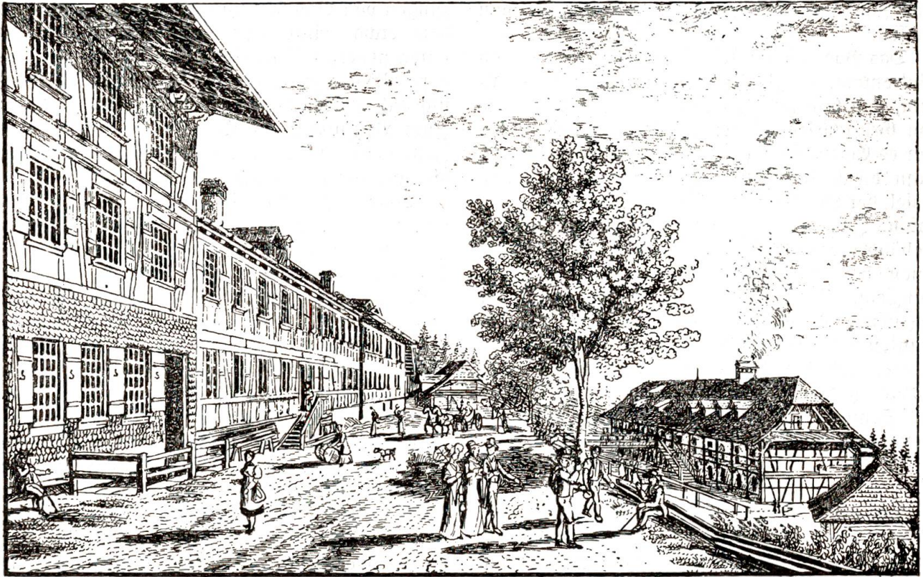
Das Gurnigelbad um 1830.

die jede 10, 20 Schritte stille stehen müssen, um wieder zu Athem und Kräften zu kommen.“ Die Badgebäude, auf einer zum Teil künstlichen Terrasse errichtet, wuchsen durch Umbauten nach und nach in die Länge und boten schon am Ende des 18. Jahrhunderts den originellen Anblick einer städtischen Häuserzeile. Aus dem Walde wurde das Wasser durch Dünkel in die Ofen und in die