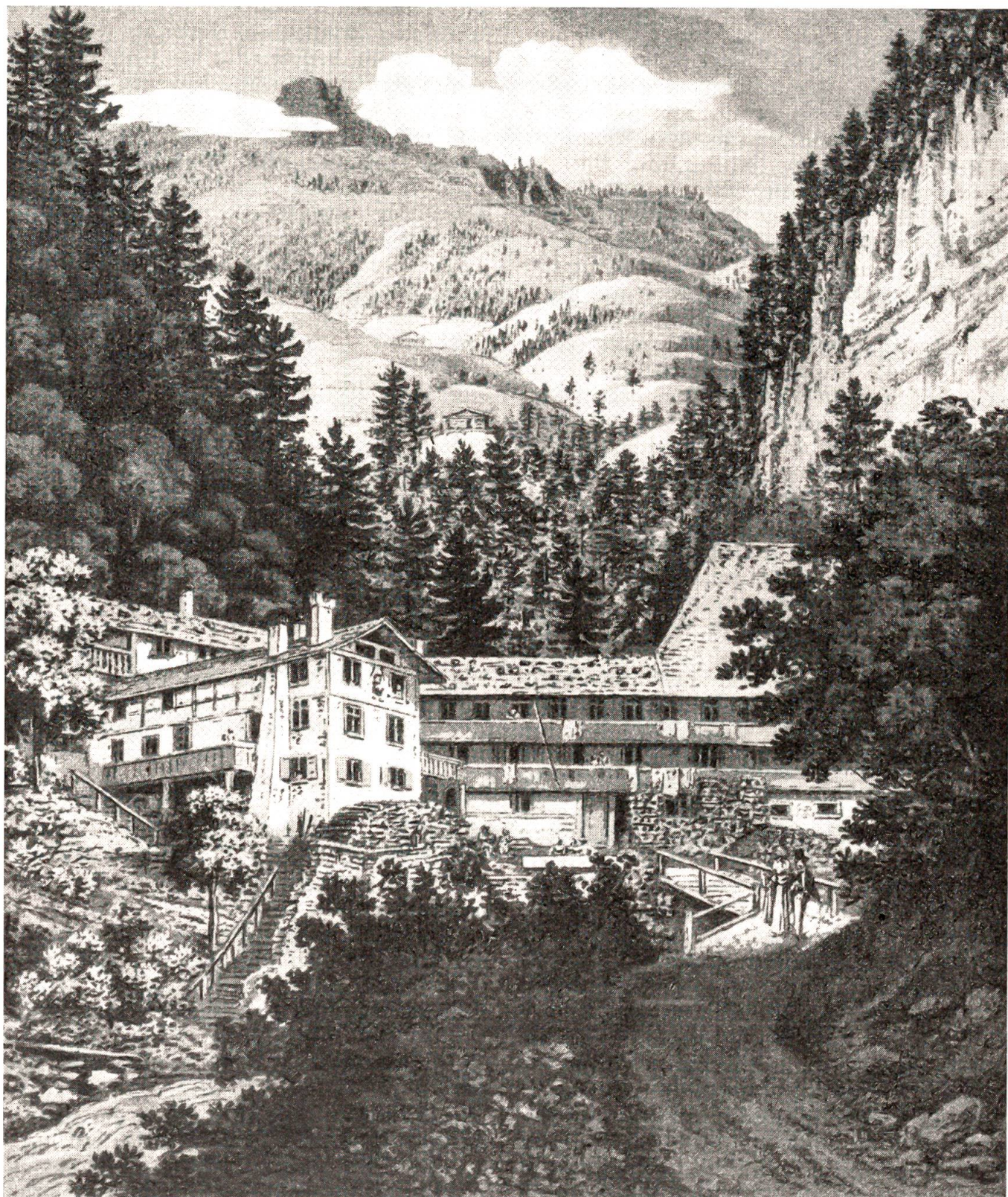
Das alte Bad Weißenburg im Anfang des 19. Jahrhunderts.