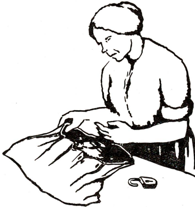
Es war kein Brief dabei...

Lieber Himmel, zu den grauen Bergen kamen nun noch die Menschen mit fremder Zunge. Da hielt der Zug, und der Schaffner rief: „Bassecourt!“