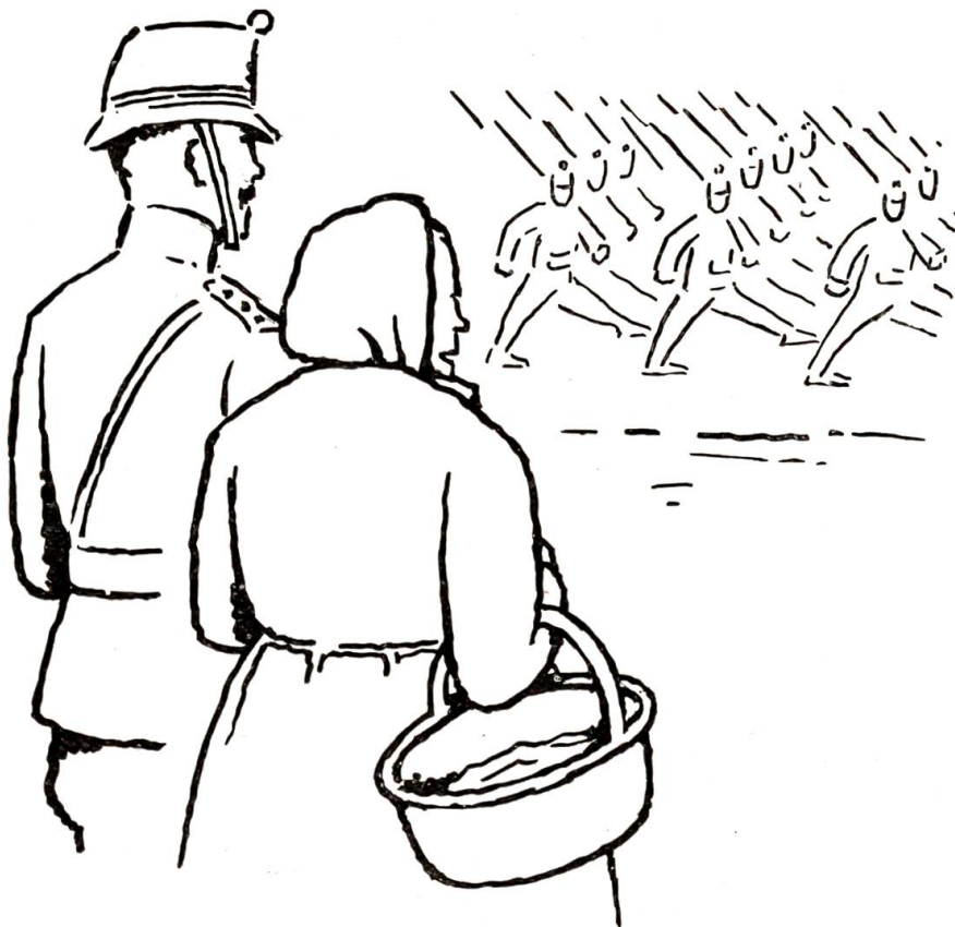
Es war eines der schönsten Defilees während der ganzen Grenzbesetzung.

Weg zur „Krone“, wo die vorsorgliche Wirtin auf das Geheiß des Hauptmannes schon eine Bettflasche in Frau Käfers Nachtlager gelegt hatte. Denn es war kalt geworden, und ein glitzernder Sternhimmel war über den nächtlichen Freibergen aufgegangen.