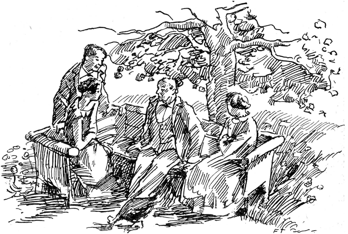
Er spricht zu einem jungen Paar, das ihm aufmerksam zuhört...

Da war es um des armen Hüterbuben Ruhe geschehen. Ein Verlangen schlug in seinem Herzen Wurzel, das zu stark war für das auf die Barmherzigkeit der Menschen angewiesene, hilflose Kind. Es trieb noch tiefer seine gierigen Wurzeln, als auf sein Herumfragen hin andere Leute die Aussagen jenes Schwägers bestätigten und bald ein jeder sagte: „Ja, du bist meiner Seel ein armer Tropf, Christeli. All Tag den schönen Hof, wo dein Vater verspielt hat, vor der Nase, und so um den Gottslohn verdinget sein müssen. Dir ist übel angerichtet worden in dieser Welt.“ Es kam hinzu, daß einmal der Lehrer in der Schule sagte, es sei auch schon geschehen, daß einer mit nichts angefangen habe und als ein reicher Mann gestorben sei. — Mehr brauchte es nicht. Hätte Christeli jeden Tag ein gemästet Kalb aufgetragen bekommen und Speck und Nidle