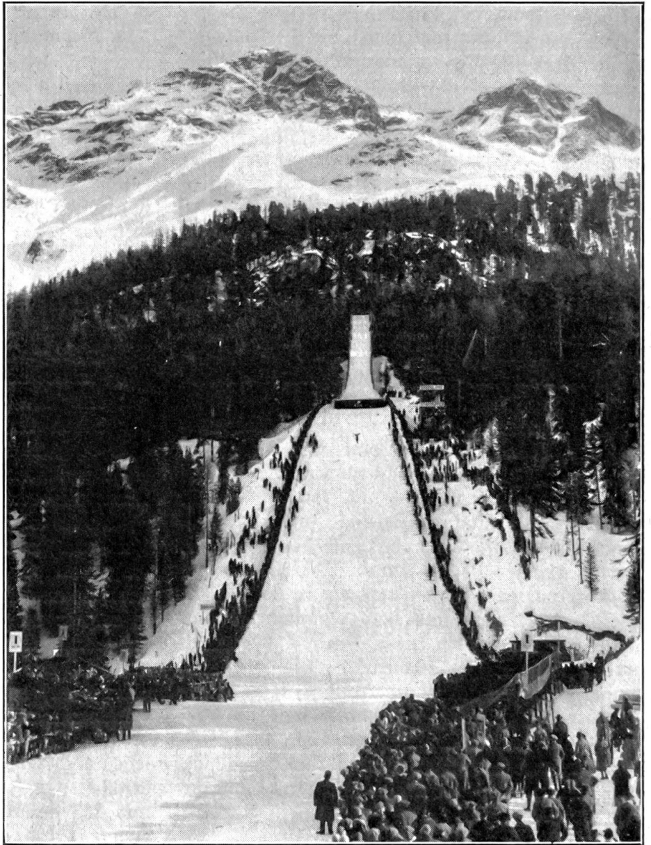
Olympiaschanze in St. Moritz.

andere kennt man wohl; aber vieles weiß man nicht zu erklären. Nun, es ist gut, geben sie uns Rätsel auf, Rätsellösen lenkt ab, wenn auch nur einen Augenblick. Rechter Schlaf, tief und fest, war uns keiner beschieden, nur eine Schicht Schlummer, dünn und durchlässig wie Fließpapier. Beide hielten wir uns still, keines wollte das andere am Einschlafen hindern oder wecken. Aber unser Weiher ist auch ruhig auf der Oberfläche, und auf dem Grunde gramfelt allerhand Grausliches umher. Erschöpft vom gezwungenen Stillliegen fragte eines