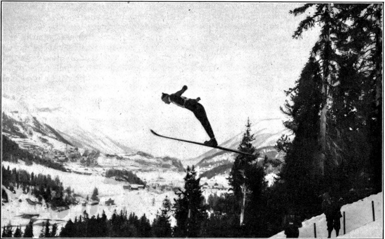
Ein vorbildlicher Sprung von Vuilleumier an der Olympiade in St. Moritz.