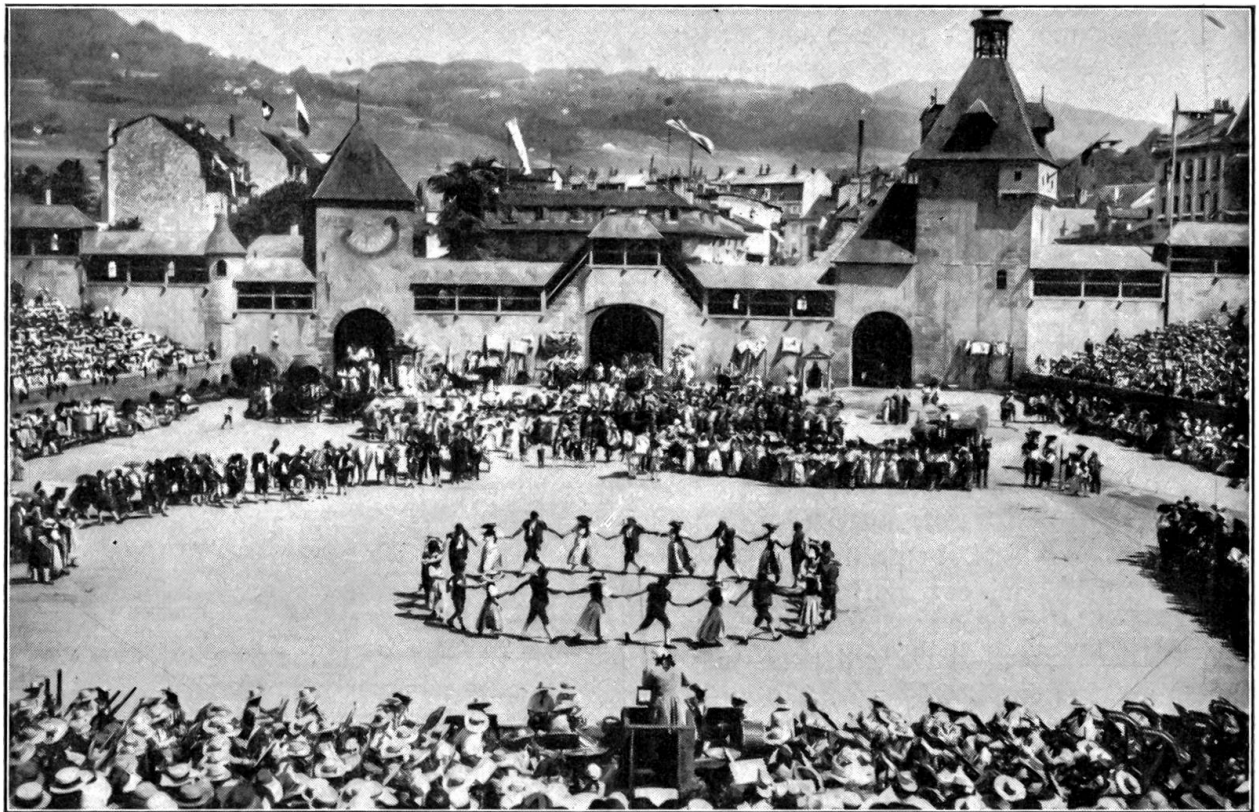
Winzerfest in Beveny.