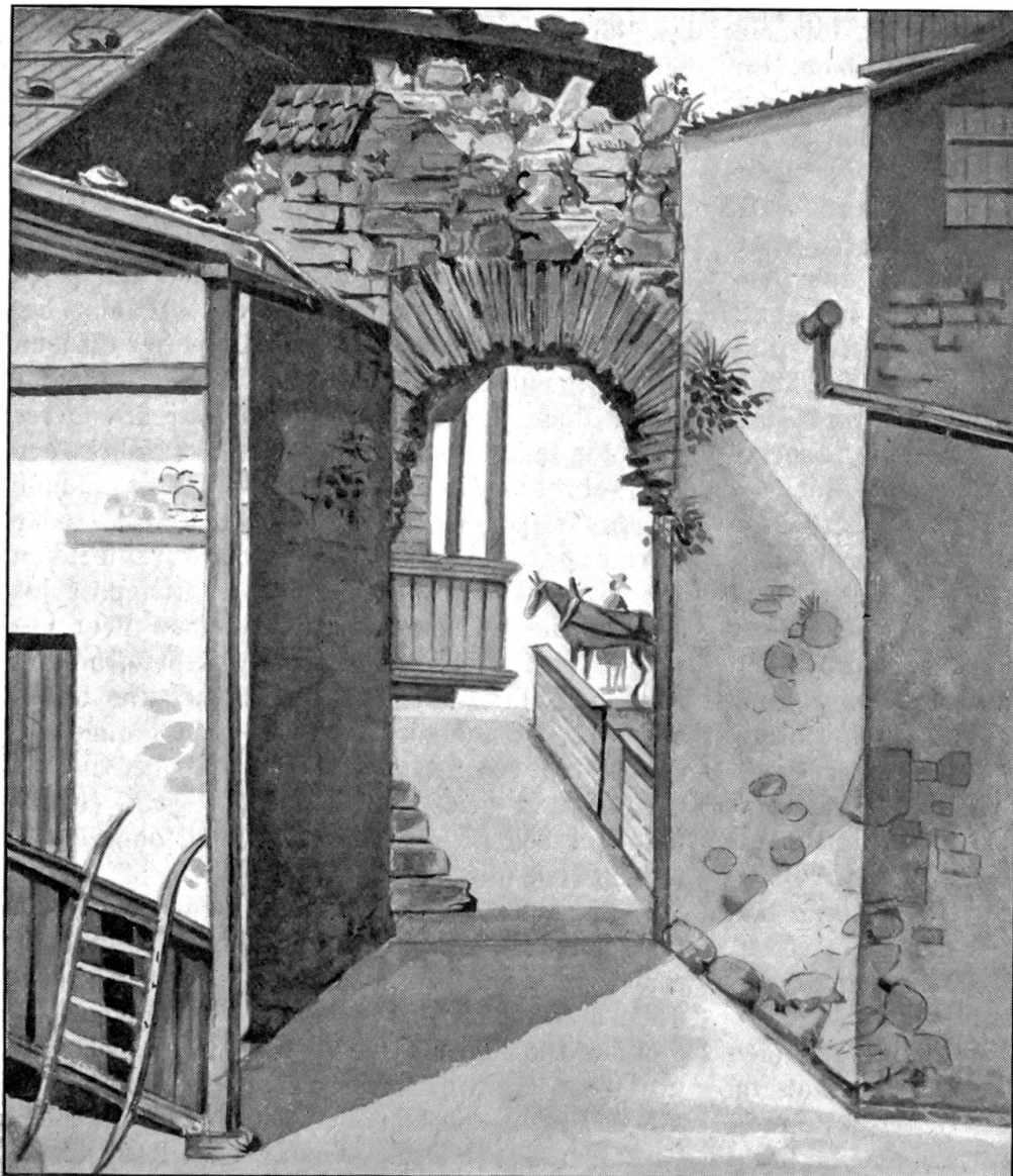
Das alte Stadttor in Spiez.

Nach einem Aquarell von Pfarrer Karl Gmwalb, um 1850.