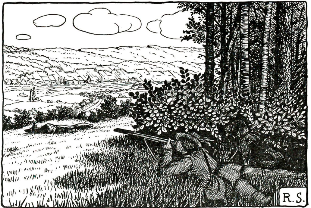
Sorglich folgte meine Laufmündung jeder seiner Bewegungen.

„So so — habt Ihr ihn, den Räuber! Jetzt hat's mir wieder gewohlet!“ rief sie mir zu, als