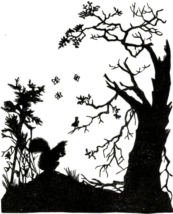
Eichhörnchen findet sein Nest und die Eiche durch den Blitz verbrannt.

„Haltet Euch gerade, streckt Euch in die Höhe, seht, so müßt Ihr's machen, daß Ihr groß und schlank werdet wie ich.“