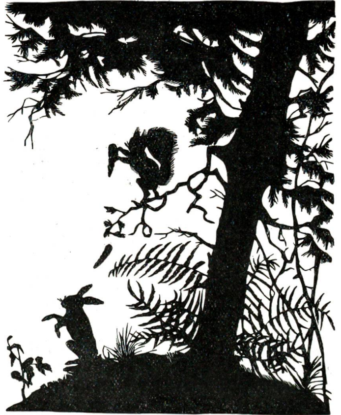
Mutter es regnet, rief ein junges Häschchen, das gerade unter der Tanne saß.

Ein Rotkehlchen war neugierig herbeigeflogen. „Quivit, komm mit!“ sang es ihm zu. „Komm, tröste Dich, die Welt ist schön, beeile Dich, sie anzusehn!“ — Da hob Pinselöhrli den Kopf und trocknete die Tränen mit dem Ende seines buschigen Schwanzes; und es sah, wie