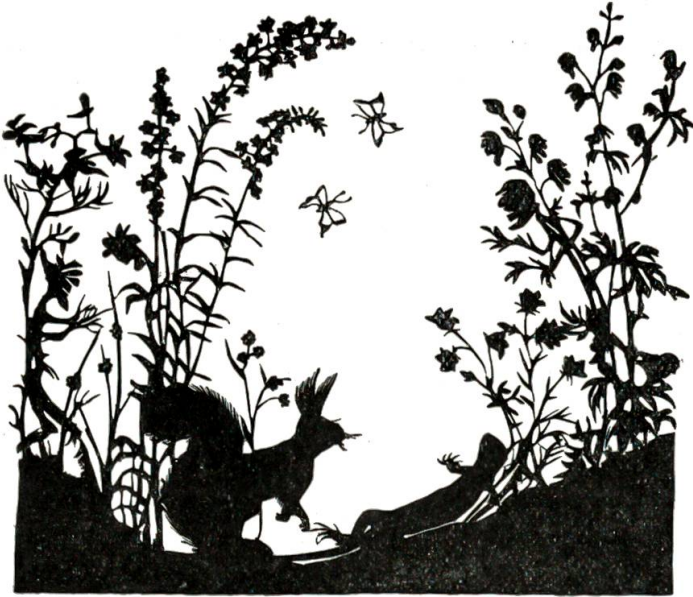
Pinseleohrli wäre beinahe über eine grüne Eidechse gestolpert, die in der Sonne lag.

dem Weidenröschen süße Augen, und der Eisenhut schaute wütend drein und drohte mit den Armen.