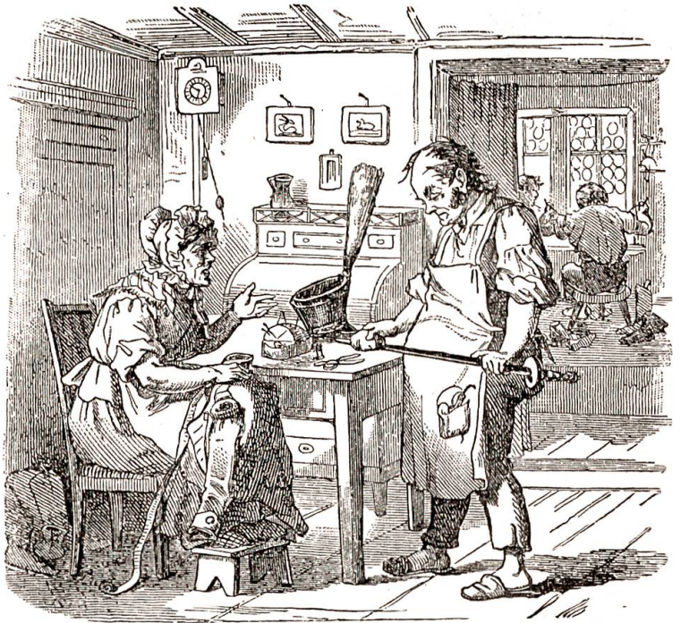
Die ganze Zeit, während der sie die fatalen Silberborten auf den Uniformkragen festnähte, benützte sie darum dazu, tüchtig loszuziehen.

Meister Scheiblig, der, solange seine Frau die Uniform unter ihren Händen hatte, zahm war, suchte die Grollende zu besänftigen, ohne jedoch sich dabei etwas zu vergehen: das sei ein Opfer des Vaterlandes, sagte er, der Wehrstand habe Weib und Kind und Vermögen zu schützen; die Silberborten kämen somit auch ihr zugute, davon, daß es eine Ehrensache sei, gar nicht zu reden. Wasser aber, scheine ihm, lasse sich in einem hölzernen Zuber ebenfogut und noch leichter tragen als in einem von Kupfer! Frau Scheiblig indes gab sich nicht sogleich gefangen: mit dem Vaterland und Opfer und dergleichen soll er doch schweigen, das sei Parifari! Und niemand hätte davon gegessen, für Herren oder Taugenichtse sei solches gut, aber nicht für Burgersleute, die von ihrer Arbeit leben müßten, und denen niemand was gebe, wenn es nicht lange. Ein Exküse sei es vielmehr fürs Nichtstun, hinter dem die Eimbildung stecke, denn in der Uniform meinten die einfältigen Mannsleute gleich, sie seien nun doppelt so viel als vorher. Was aber den hölzernen Wasserkuber betreffe, so bekomme darin das Wasser immer einen Abgeschmack, er selber trinke ja nie davon! — Fürs Trinke