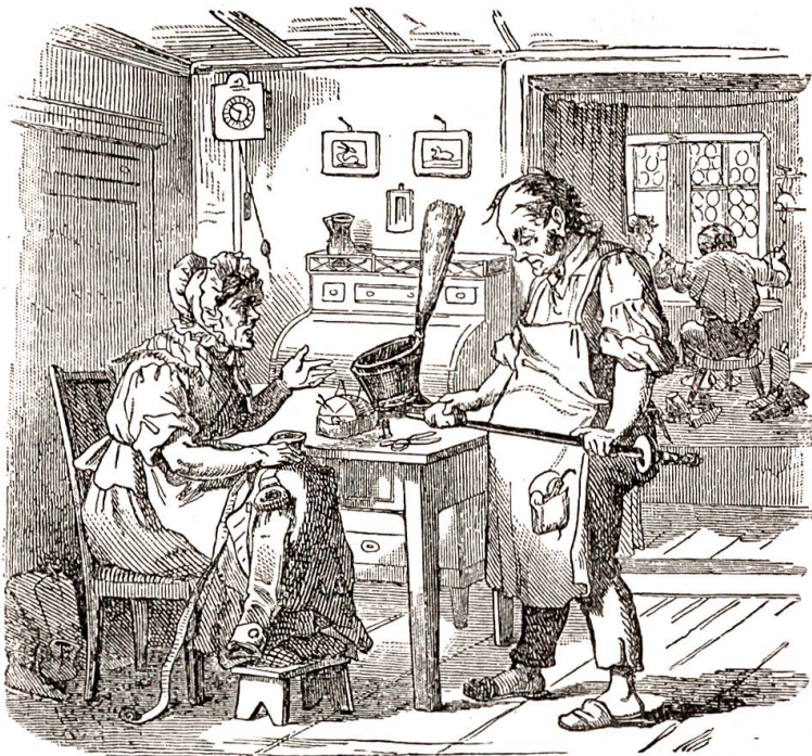
Die ganze Zeit, während der sie die fatalen Silberborten auf den Uniformkragen festnähte, benützte sie darum dazu, tüchtig loszuziehen.

Meister Scheiblig, der, solange seine Frau die Uniform unter ihren Händen hatte, zahm war, suchte die Grollende zu besänftigen, ohne jedoch sich dabei etwas zu vergeben: das sei ein Opfer des Vaterlandes, sagte er, der Wehrstand habe Weib und Kind und Vermögen zu schützen; die Silberborten kämen somit auch ihr zugute, davon, daß es eine Ehrensache sei, gar nicht zu reden. Wasser aber, scheine ihm, lasse sich in einem hölzernen Zuber ebensogut und noch leichter tragen als in einem von Kupfer! Frau Scheiblig indes gab sich nicht sogleich gefangen: mit dem Vaterland und Opfer und dergleichen soll er doch schweigen, das sei Variari! Und niemand hätte davon gegessen, für Herren oder Taugenichtse sei solches gut, aber nicht für Burgerleute, die von ihrer Arbeit leben müßten, und denen niemand was gebe, wenn es nicht lange. Ein Exküse sei es vielmehr fürs Nichtstun, hinter dem die Einbildung stecke, denn in der Uniform meinten die einfältigen Mannsleute gleich, sie seien nun doppelt so viel als vorher. Was aber den hölzernen Wasserzuber betreffe, so bekomme darin das Wasser immer einen Abgeschmack, er selber trinke ja nie davon! — Fürs Trink-