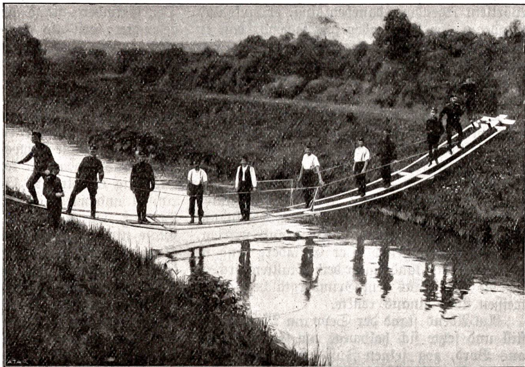
Herstellung einer fliegenden Brücke.

An einem Tage ist ein Brief in den Grimberg getragen worden. Der Grimberg hat fast den ganzen Nachmittag, bis er ihn gelesen. Da steht darin, daß der Bub im Lazarett liegt; er hat sich in einer Nacht beim Patrouillengehen übel gewirset und liegt jetzt lahm zu Bett.