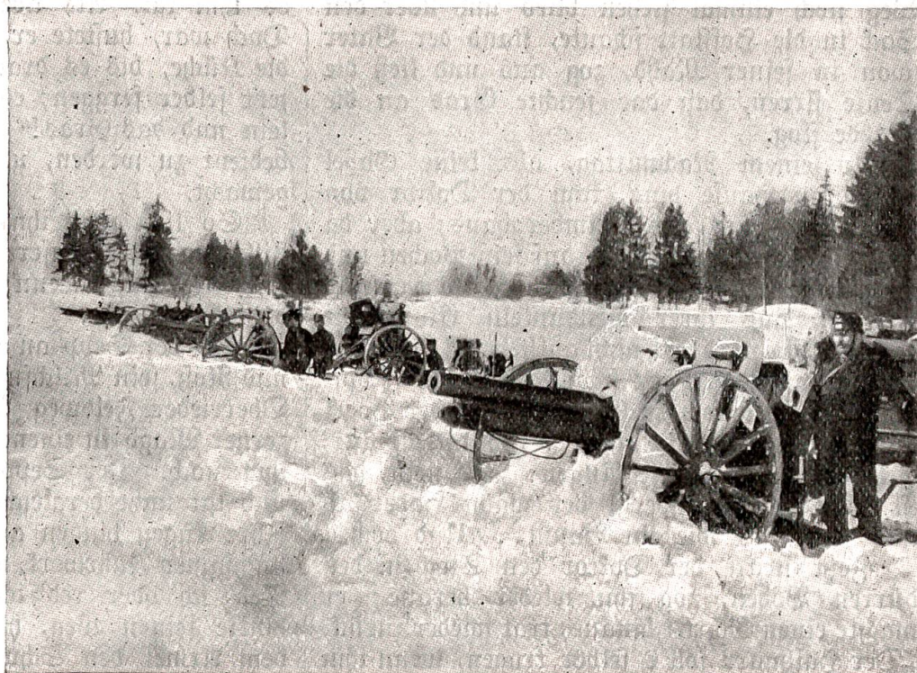
Schießübungen einer Feldbatterie in den Jurabergen.

In Seppli's Augen leuchtete etwas auf, er machte einen Schritt nach der Fenntür, als ob er dem Vater ein Wort noch sagen möchte; aber wie der alte Mann in der Eichtung mit der ausgestreckten Hand nach dem Wege wies, der vom Haus hinaus und in die Straße führte, kehrt' er sich um, wie einer, den des Alten Wort und Wink gezwungen. In einer Hast, als ob er eine veräumte Frist einbringen müßte, holte Seppli seine Ausrüstung herab. Als der Alte aus dem Stalle kam, stand der Soldat am Fenster und blickte durch den Gewehrlauf. Er sah dem Alten entgegen, als