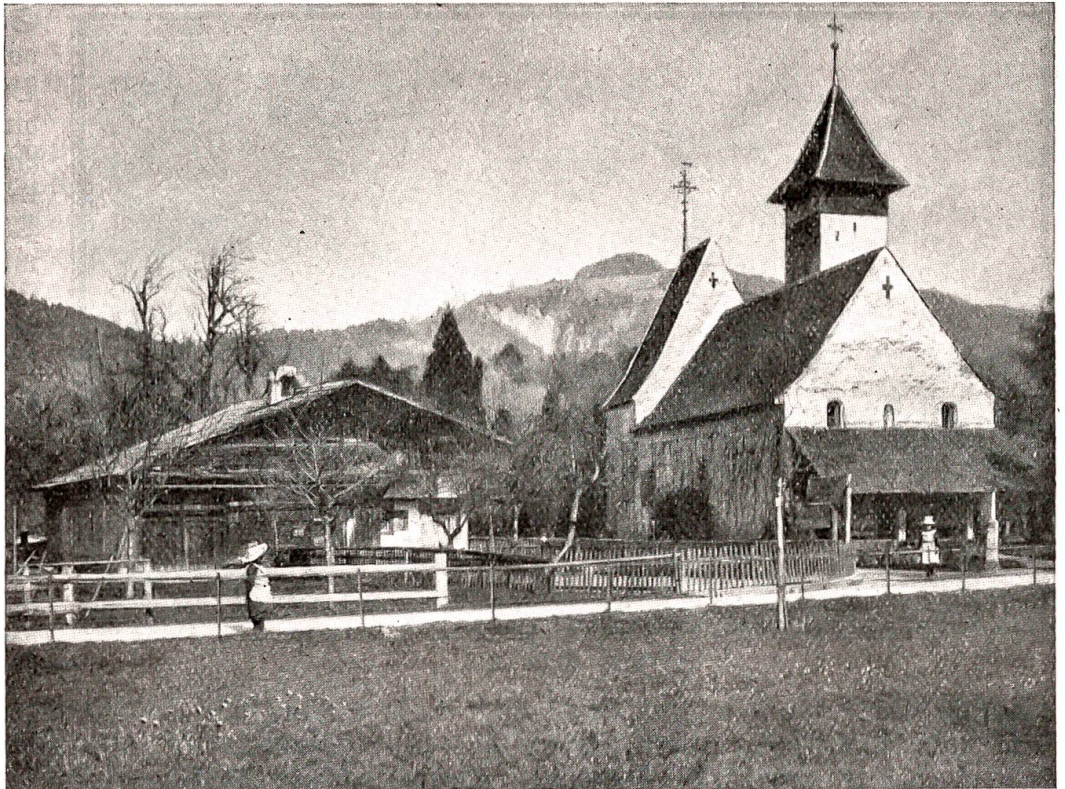
Kirche von Scherzligen.

Gegen die Thunerallmend hin, an der Straße von Thun nach Amfoldingen, liegt das stark bevölkerte Allmendingen. Hier befand sich eine offenbar nicht unwichtige römische Niederlassung. In den Jahren 1824 und 1825 wurden in einem an die Allmend grenzenden Grundstück Fundamente von Gebäuden bloßgelegt, wobei eine Menge von teils sehr wertvollen Fundstücken zutage befördert wurden, so über 1200 meist bronzene römische Münzen von Augustus bis Konstantin, Haften, Opferbeile, Basreliefs, Opfertiere darstellend, ein Mithras-