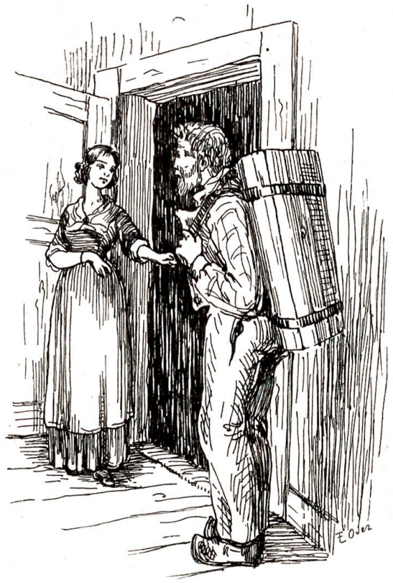
Sie drückte die Zigarre mit einem „Zwanziger“ extra in seine Hand.

„Hans.“ Verwundert blickte der Knabe auf, ungewohnt, daß ihn der stille Heiri anredete, und gar noch mit dem Namen. Ihr Verhältnis war ein ganz eigenartiges, ihre Sympathie zueinander unausgesprochen. In