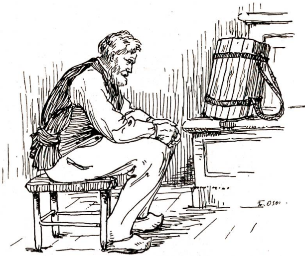
Nun starrte er dorthin, während ihm im Herzen immer schwerer wurde.

ihnen aussendete, und der sie von ihren Streifzügen zum Milchtopf heimrief. Er setzte sich an den Tisch, dachte aber nicht ans Essen. Seine Bücke hatte er, statt drunten im Gang zu lassen, mit sich heraufgenommen und auf die Ofenbank gestellt; nun starrte er dorthin, während ihm im Herzen immer schwerer wurde. Wie lange wohl durfte er jetzt noch seinen Posten ausfüllen und mit allen besseren Familien im Städtchen durch wichtige Dienstleistung im täglichen Verkehr stehen? Würden denn wirklich alle mit der Wasserversorgung einverstanden sein? Präsidents, den Professoren, denen im Sternen, im Schiff, im Mohrenkopf, im Weißen Haus, im Hösli, im Sommerhaus und im Steinböckli — war es ihnen allen gleichgültig, wenn der Heiri nicht mehr kam? Jesses! und seine „Muttergottes“ hatte es ihm gesagt — sie freute sich auf die Wasserversorgung ... warum sollten es erst die andern nicht tun? Er nahm die von ihr geschenkten Zigarren aus der Tasche und hielt sie vor sich hin im Schoß.