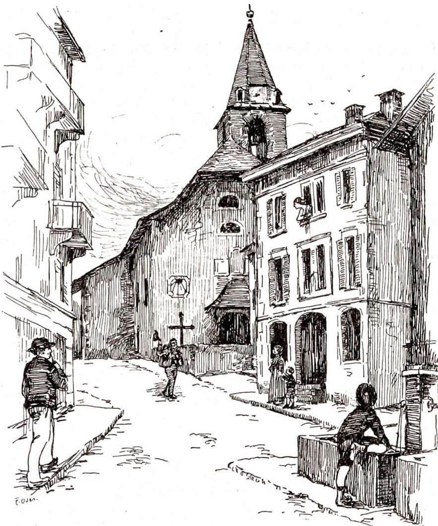
Dort aus der Gasse erschien festen Schrittes der Heiri.

Zum Abschied gab ihm die Frau Amtmann auch noch die Wasserstände aus der Küche, weil sie wußte, daß diese von allen, welche er gefüllt, ihm immer die liebste gewesen war. Er trug sie heim in die Stube, saß davor und sann und sann bis in die Nacht hinein. Dann rückte er sie ans Bett, entkleidete sich, nahm von diesem mit seinen Katzen Beschlag und ging nach einer Weile in den Schlaf über.