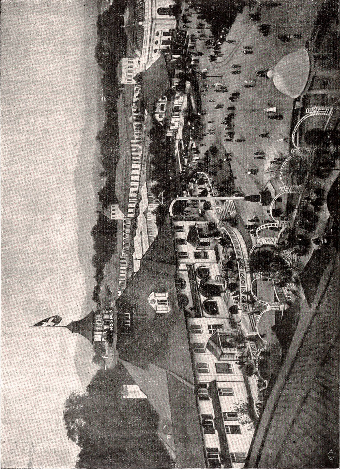
Schweizerische Landesausstellung in Bern. Soepes.