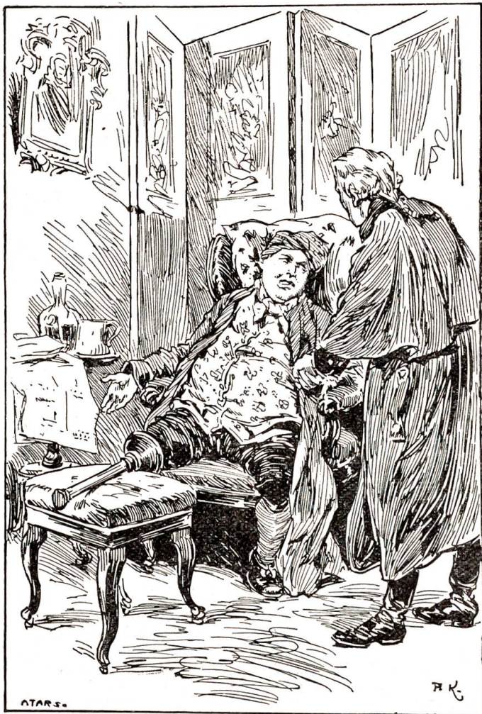
In einem Beinsessel saß ein dicker Herr, . . .

und zärtliches Weib, doch nicht zu viel, wenn man am Ende nicht beim Tausch betrogen wird. Adam mußte den Besitz seiner Gemahlin mit einer Rippe im Leibe bezahlen, auch andere Männer kostete ihre Schöne eine Rippe, andere sogar den Kopf.