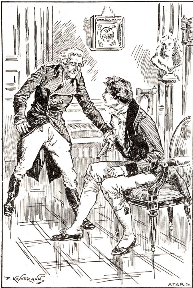
Der Brit nahm die Pistole und hielt die Mündung hart über das Knie.

„Ich kann Ihnen die Wahrheit jetzt nicht sagen — vielleicht nach einem Jahr. Aber, ich wette, Herr, ich wette, Sie selbst sollen nach Jahresfrist gestehen, daß meine Gründe die edelsten waren, von diesem Bein befreit zu sein.“