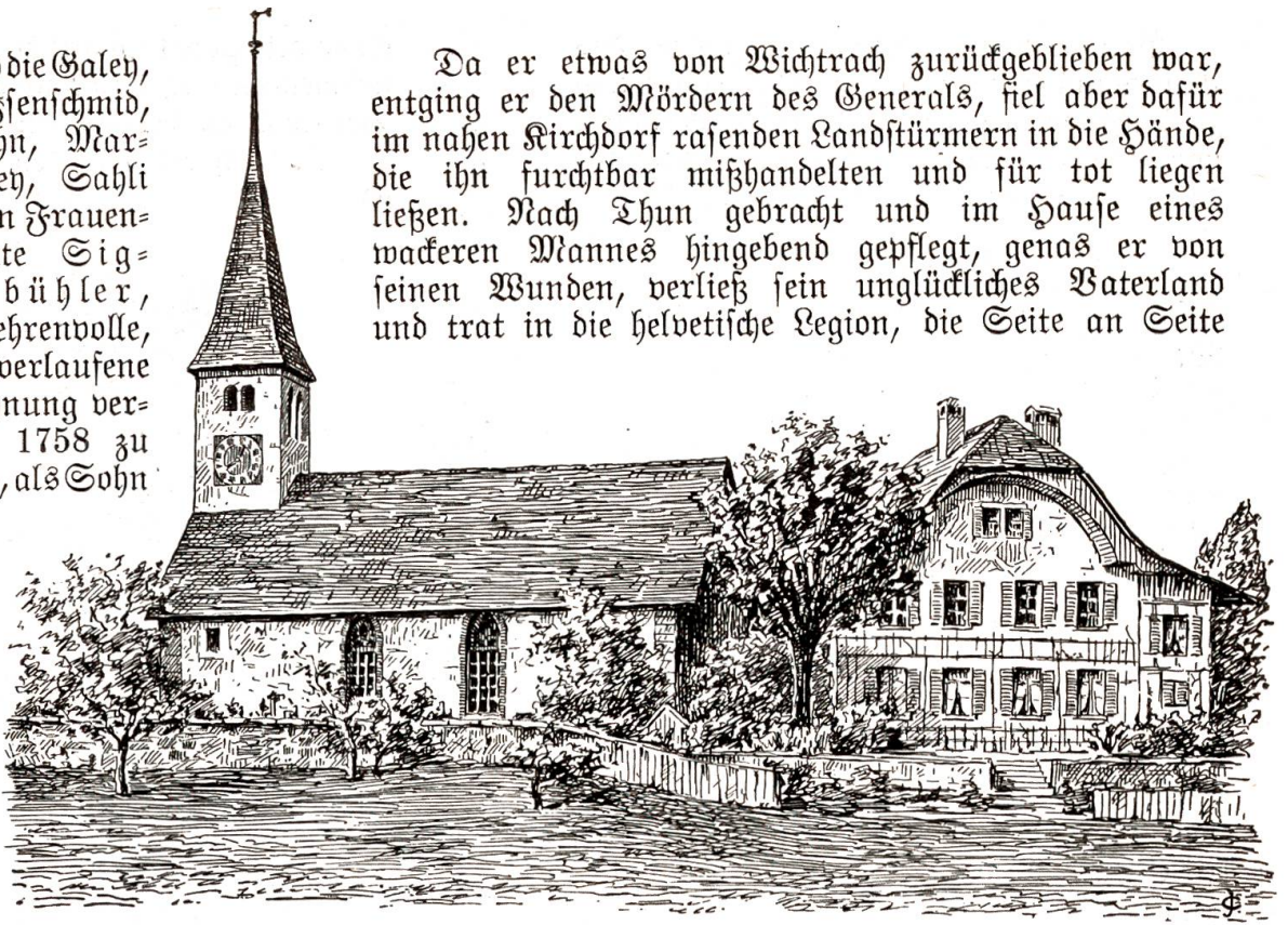
Kirche und Pfarrhaus von Frauenkappelen.

Da er etwas von Wichtach zurückgeblieben war, entging er den Mördern des Generals, fiel aber dafür im nahen Kirchdorf rasenden Landstürmern in die Hände, die ihn furchtbar mißhandelten und für tot liegen ließen. Nach Thun gebracht und im Hause eines wackeren Mannes hingehend gepflegt, genas er von seinen Wunden, verließ sein unglückliches Vaterland und trat in die helvetische Region, die Seite an Seite