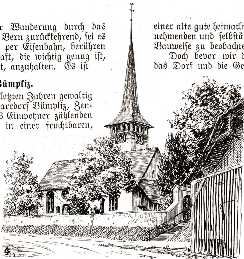
Kirche von Bümpliz.

Grabarbeiten auf dem Friedhofe zutage gefördert wurden. Sehr wahrscheinlich war Bümpliz schon zur karolingischen Zeit ein dem Reiche gehörender Meierhof. Jedenfalls auf Bümpliz weist der Ortsname Pimpinengis hin, wo, laut 1019 ausgestellter Urkunde, König Rudolf III. von Burgund einen Tausch zwischen der Abtei St. Maurice und einem gewissen Amiso um Güter in Rugerol am Bielersee bestätigte. 1026 folgt eine vom nämlichen König in Pimpinga ausgestellte Urkunde. 1228 erscheint Pipinnant als Pfarrei des Bistums Lausanne. 1235, am 31. Mai, schenkt Kaiser Friedrich II. die Kirche von Bümpliz mit den Gotteshäusern von Köniz, Bern, Mühleberg und Überstorf dem Deutschen Orden. 1306 hat ein Thüring von Bümpliz seine beiden Töchter, die ins Kloster Fraubrunnen traten, mit Gütern in Bümpliz ausgestattet. 1345 verkauft Richard von Maggenberg, Kirchherr zu Belp, mit Einverständnis seines Bruders, des Schultheißen von Freiburg, den Hof