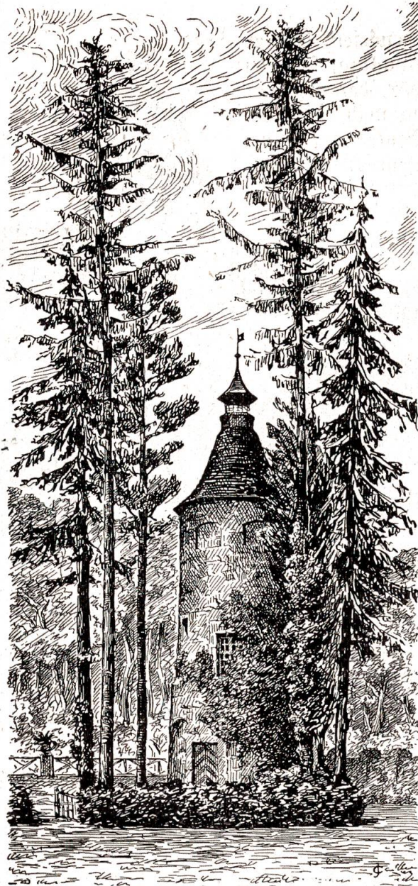
Taubenturm im Schloßpark von Villars-les-Moines (Münchenwiler).

Es ist eine Stätte alter Kultur, auf der wir stehen. Im Jahre 1080 vergaben zwei Brüder, Gerold und Rudolf von Villars, ihr Eigentum daselbst dem Kloster Clugny in Hochburgund, das nun hier eine Art Zilliale errichtete, ein Priorat mit einer der heiligen Dreifaltigkeit geweihten Kirche. In der Zeit der Erbauung mag es geschehen sein, daß, vielleicht vom Mutterkloster aus, dem neugegründeten Gotteshaus jenes, wie das Material beweist, aus der Champagne stammende, seltsame Steinbildwerk, die Kreuzigung darstellend, geschenkt wurde, ein Werk aus der Merovingerzeit, das in der ehemaligen Klosterkirche eingemauert und als eines der ältesten christlichen Kunstdenkmäler unseres Vaterlandes, in archäologischen Kreisen wohl bekannt, schon Gegenstand fachmännischer Forschungen geworden ist. Das seit dem 14. Jahrhundert