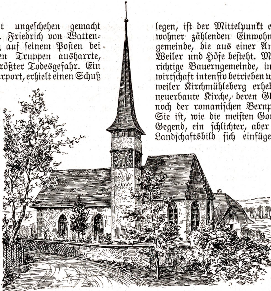
Kirche von Mühleberg.

Das Pfarrdorf Mühleberg, 585 m hoch, auf einer Anhöhe rechts über der Saane ge-