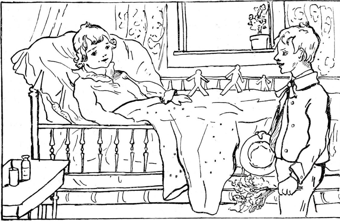
Er ließ eben seine aus Papier ausgeschnittenen Soldaten auf der Bettdecke exerzieren.

faßt, wenn dieser sich nicht mit der Behendigkeit einer Katze bis vor die Türe geflüchtet hätte. Durch die Türspalte rief er: „Ich wollte weder betteln noch stehlen, ich wollte nur nach Rolly Ringmann fragen,“ ein Schluchzen drohte Hansens Stimme zu ersticken, „was ist aus ihm geworden?“