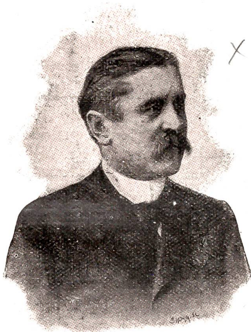
Alt-Bundesrat Numa Droz.