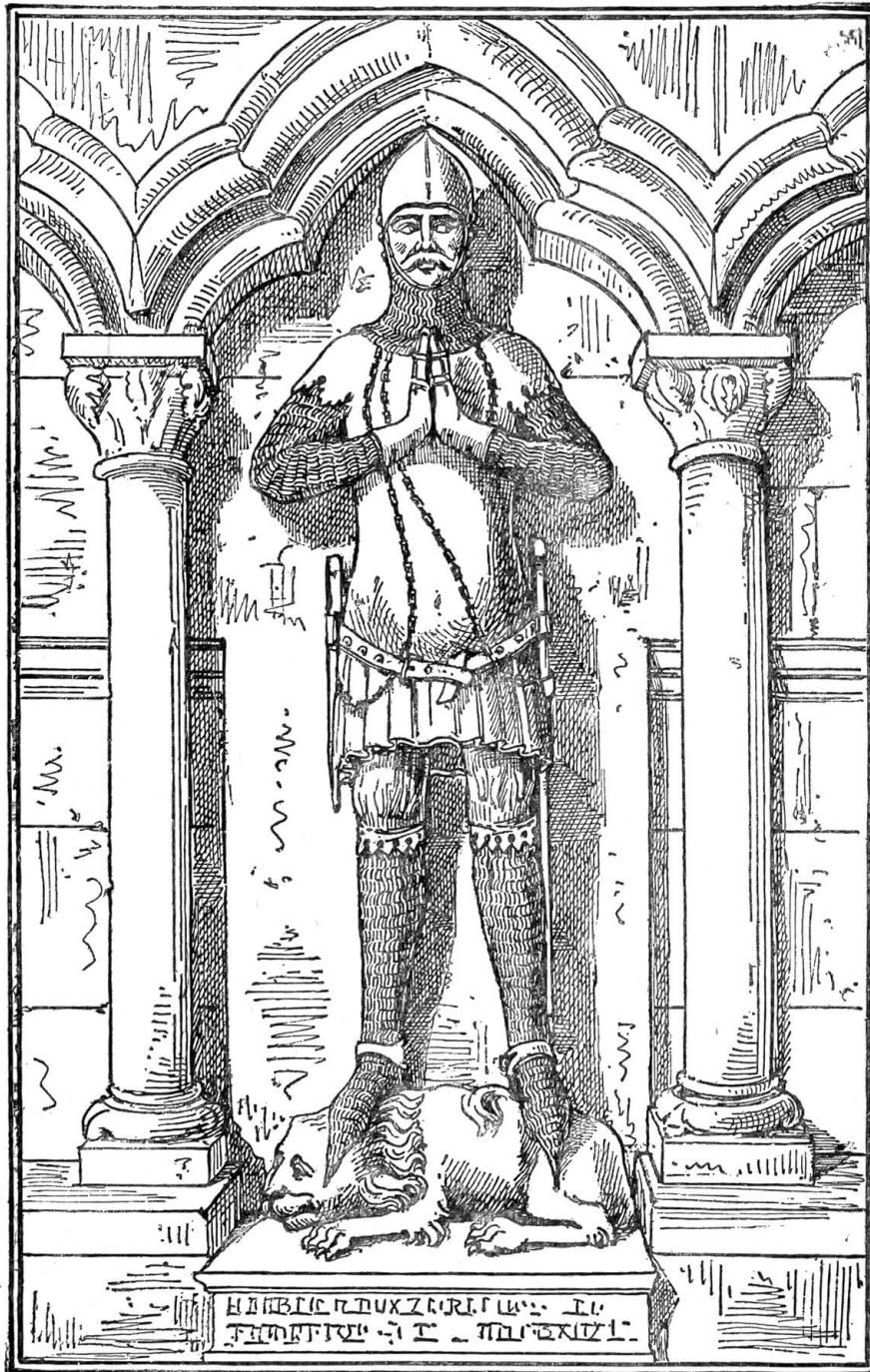
Im Münster von Freiburg i. Breisgau