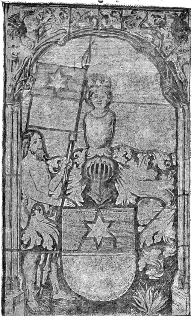
Wappen der Bubenbergs.

Auch das Aussehen der Stadt kann man sich im 13. Jahrhundert kaum bescheiden genug denken. Wenn einer jener ersten „Bürger“ heute wiederkäme und unsere mächtigen Sandsteinbauten erblickte, er würde seine Wohnstätte nicht wiedererkennen. Dorfartig, durch Gärten, Scheuern, Stallungen unterbrochen, waren die hölzernen Häuser aneinander gereiht. Die Dächer zeigten zwar gewiß von Anfang an die burgundische, die Front des Hauses wagrecht abschließende Form im Unterschied von den schwäbischen Giebelhäusern, wie sie in Schaffhausen, Zürich und Zug die Regel bildeten. Auch die Lauben waren schon in den Anfängen vorhanden. Aber die Bedachung bestand nur aus Stroh oder Schindeln, letztere wohl auch noch mit sogenannten „zentrigen Dachnägeln“, d. h. Steinen, beschwert, wie