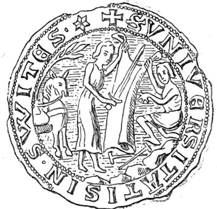
Zweites Siegel von Schwyz.

wie in Uri, nur daß in Schwyz Oesterreich statt des Reiches die Oberhoheit ausübte.