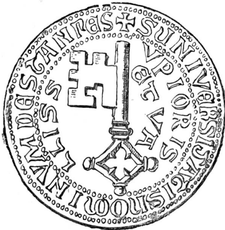
Ältestes Siegel von Unterwalden.

ungünstiger. Die Zahl der Freien war gering, die Hauptmasse bestand aus Hörigen. Namentlich die Habsburger verfügten über großen Grundbesitz, der mit solchen besetzt war, und es ist nicht zufällig, daß die Sage die meisten Bedrückungen habsburgischer Vögte in dieses Ländchen verlegt. Dagegen finden wir doch schon 50 Jahre zuvor Andeutungen über eine bestehende engere Verbindung mit Luzern. Um 1245 treten Freie aus Unterwalden, größtentheils Ritter, unter diesen ein Winkelried, bei einer Verhandlung in der Nähe Zürichs zu Gunsten von Engelberg auf. Dabei gebrauchten sie, „in Ermangelung des Siegels, das wir nicht