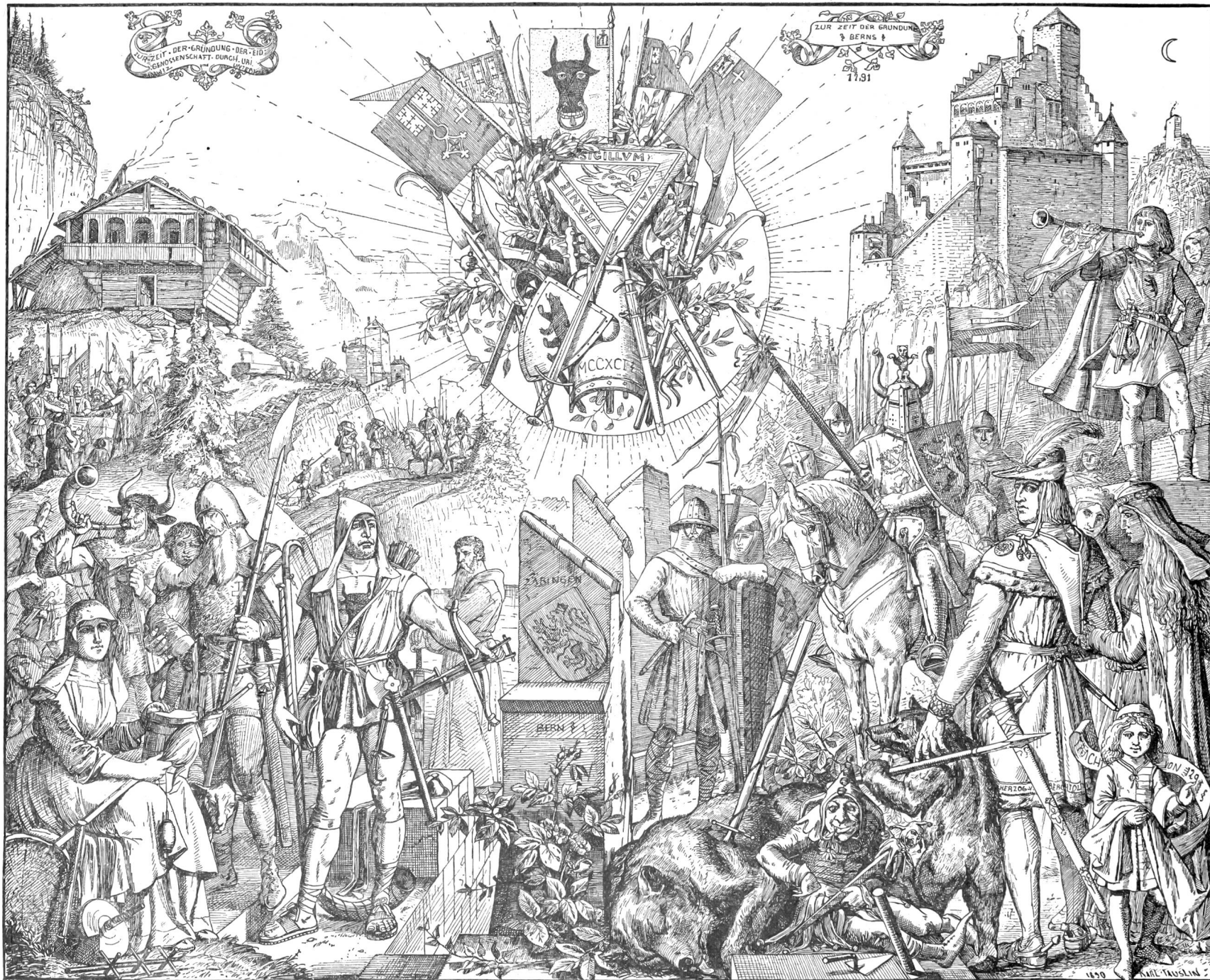
Trachtenbilder aus den Zeiten der Gründung der Stadt Bern (1191) und der Eidgenossenschaft (1291).