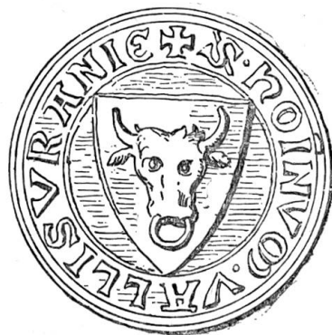
Zweites Siegel von Uri.

Die erste Gefahr drohte seiner ziemlich freien Stellung durch die Zähringer. Berchtold V. war Reichsvogt und Schirmvogt zugleich, nannte Zürich mit Vorliebe „seine Abtei“ und hätte wohl gerne in unsern Landen ein erbliches Reich gegründet; allein 1218 starb er ohne einen männlichen Erben. Kaiser Friedrich II. behielt Anfangs die an's Reich zurückgefallenen Rechte der hohen Gerichtsbarkeit seinem eigenen Hause vor, übertrug sie dann aber den Grafen von Habsburg. Dadurch entstand eine neue Gefahr. Die Habsburger waren bereits Landgrafen im Elsaß, Rastvögte über das Kloster Säckingen, welchem Glarus gehörte, über Luzern, das ein Filial des Stifts Murbach im Elsaß war, und endlich Grafen des Zürichgau's. Außer ihren Stammgütern im Aargau, wo heute noch ihre allerdings etwas zusammenge-