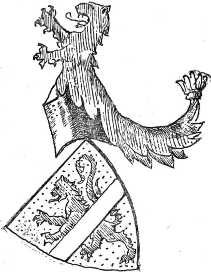
Die von Silenen.

lich 1243 als Meier der Aebtissin von Zürich und hatten ihren Ritteritz im Thurm zu Silenen, der heute noch im Dörfchen Ober-Silenen an der Gotthardstraße fünf Stockwerke hoch sich erhebt. Ueber die Attinghusen hat der „Sinkende Bote“ gelegentlich seines historischen Streifzugs in's Emmenthal, wo sie ursprünglich auf der verschwundenen Burg Schweinsberg bei Eggwyl saßen, eingehender berichtet (siehe S. B. Jahrgang 1889). Die Urner Linie des Geschlechts, die