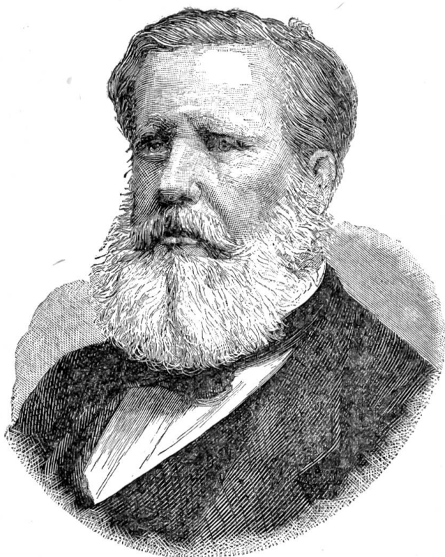
Kaiser von Brasilien.

Gram über den Verlust des Thrones. — Mit jener unblutigen Revolution ist die letzte Monarchie in der neuen Welt zu Grabe getragen. Neue Monarchien gibt's überhaupt in der Welt kaum mehr, wohl aber neue Republiken. Das ist der Windzug der neuen Zeit, der in vielen Residenzen unangenehm verspürt wird.