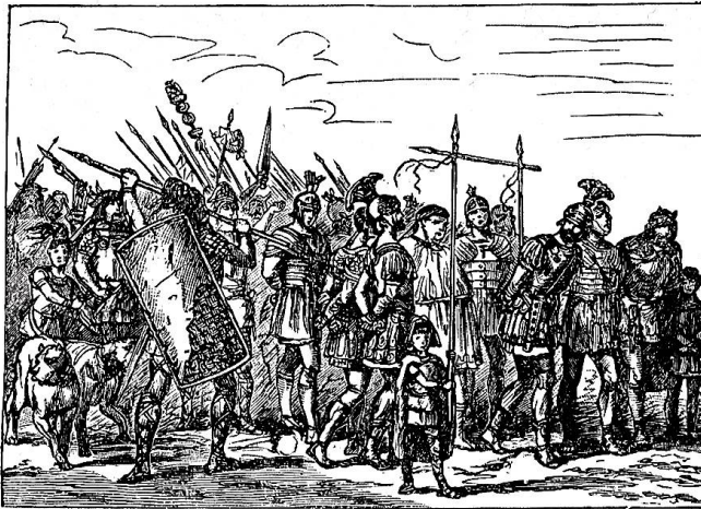
Selbeter und gefangene Römer.

müthigen, langgezogenen Tönen stimmte auch der Anblick der gehörnten, mit Fellen bekleideten Pfahlbauern, die den Zug eröffneten. Kraftvolle Gestalten vertraten dieses Urvolk, von dem uns die in den Schweizerseen gefundenen Ueberreste ziemlich genaue Kunde geben. Die Pfahlhütte auf dem Wagen und der nachfolgende von drei indianerhaften Gestalten geruderte Einbaum waren außerordentlich gelungen. Es folgten die alten Selbeter unter Diviko, schon etwas zivilisierter aussehend und hinter sich gefangene Römer herführend, die zur Schmach unter dem Speergalgen durchziehen müssen. Sodann kam eine der prachtvollsten Gruppen des ganzen Zuges, Herzog Berchtold von Zähringen mit Gemahlin