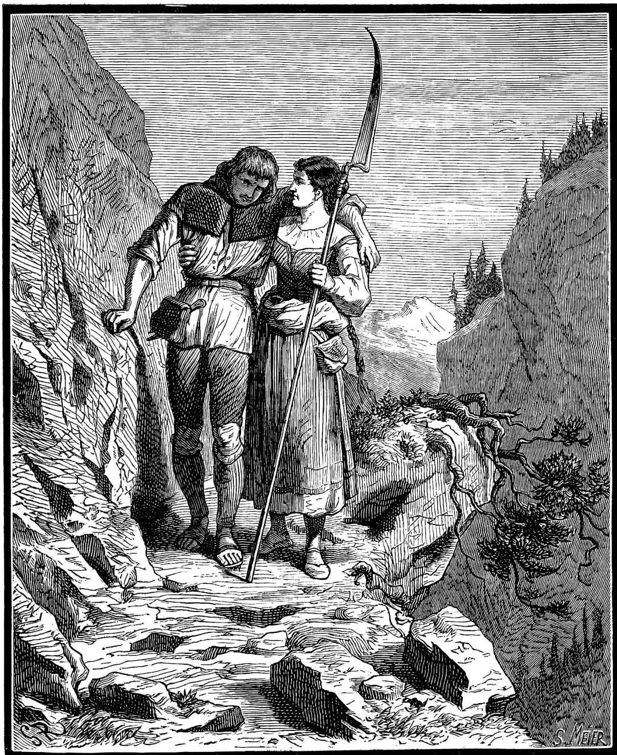
Die Weiberschlacht auf der Dangermatte.