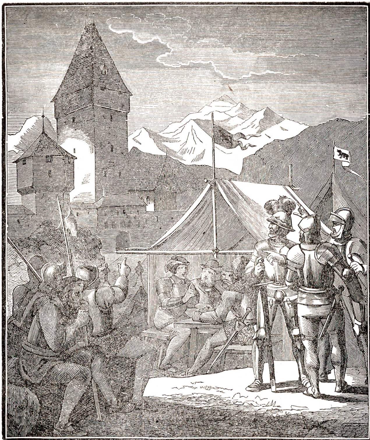
Die Belagerung von Unspunnen.