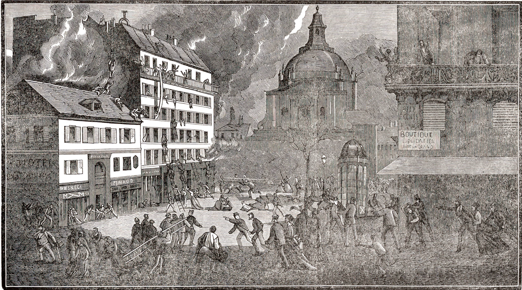
Die Explosion auf dem Sorbonneplatz in Paris.