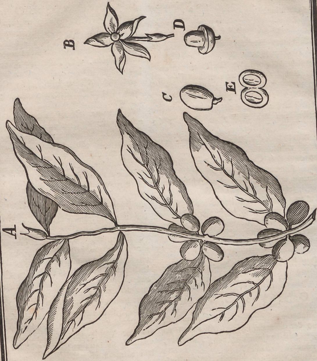
A. Ein Zweig mit Blättern und Beeren. B. Die Blüthe. C. Die Frucht ganz. D. Der Kern in der Frucht. E. Der Kern allein.