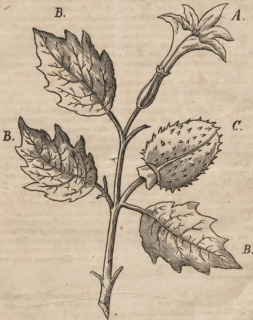
A. Die Blume. B. Die Blätter. C. Die Frucht, oder die Hülse worin die giftigen Samenkörner liegen.