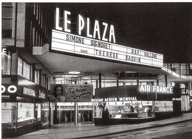
Die Beschriftung und die Werbung des Kinos und der verschiedenen Zugänge zur Rue du Cendrier und zur Rue de Chantepoulet sind ein wesentlicher Bestandteil der Architektur des Mont-Blanc Centre.

La signalétique du cinéma et de ses différents accès sur les rues du Cendrier et de Chantepoulet est un élément constitutif de l'architecture de Mont-Blanc Centre.