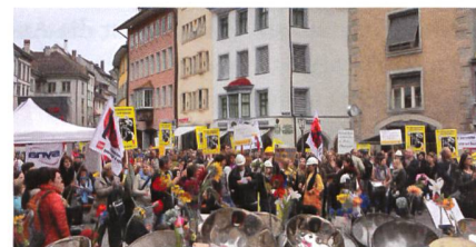
Bundnis Zukunft Schaffhausen