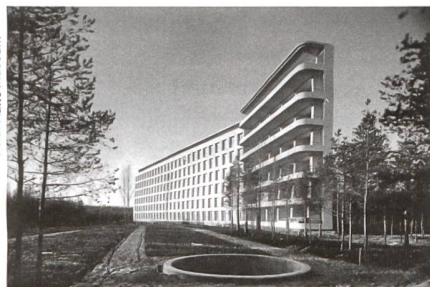
Alvar Aalto Museum