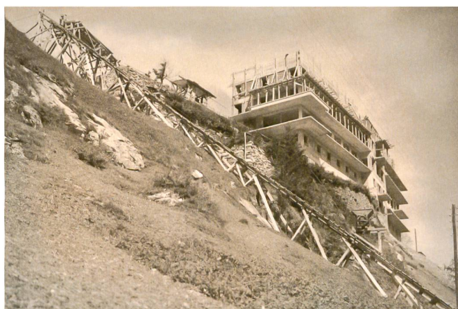
Das Doppelhotel Alpina & Edelweiss während der Bauzeit 1927 Le double hôtel Alpina & Edelweiss lors de sa construction en 1927

Dans les régions alpines voisines, le mouvement moderne a prospéré au Tyrol du Nord et du Sud. Dans le Tyrol du Nord, l'Hôtel Seegrube, signé Franz Baumann, ou encore l'Hôtel Berghof à Seefeld, dessiné par Siegfried Mazagg, comptent au nombre des réalisations majeures de l'architecture moderne. Dans le Tyrol du Sud, l'Hôtel Drei Zinnen à Sesto conçu par Clemens Holzmeister, l'Hôtel Monte Pana dans le val Gardena, réalisé par Franz Baumann, ou le Sporthotel du val Martello de l'architecte milanais Gio Ponti sont des œuvres architecturales remarquables.