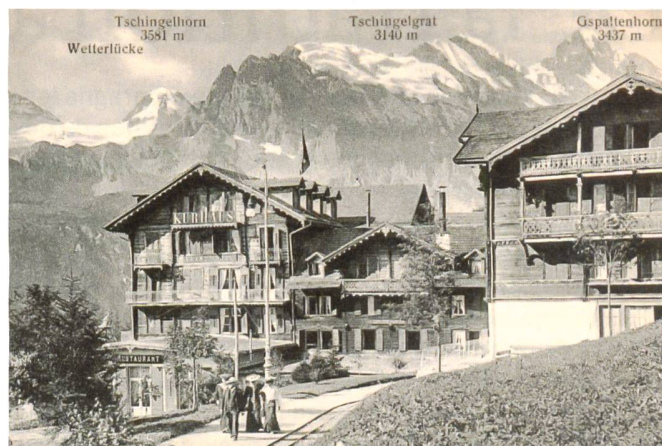
Seit 1894 wurden die Hotelgäste des massiv ausgebauten «Grand Hotel Mürren & Kurhaus» mit dem eigenen Rösslitram abgeholt.

Les Hôtels Silberhorn (à droite, ouvert en 1858) et Mürren (à gauche, ajouté en 1871, avec l'avancée perpendiculaire datant de 1876)