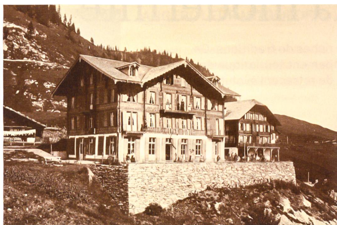
Die Hotels Silberhorn (rechts, 1858 eröffnet) und Mürren (links, 1871 hinzugefügt, mit Querfirst von 1876)