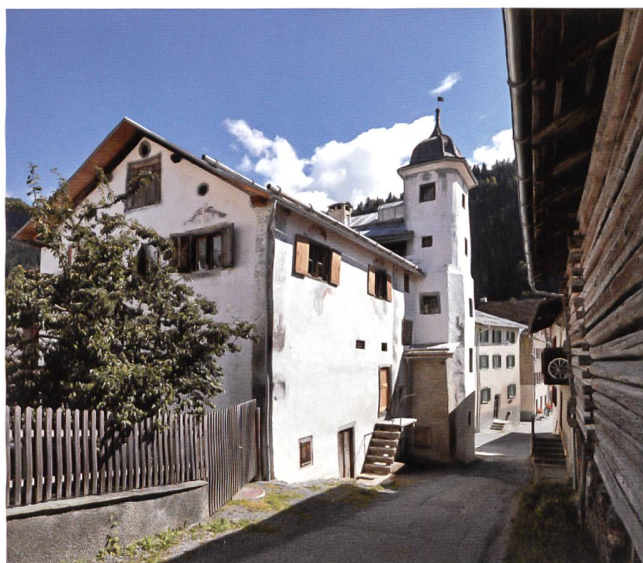
▼ STÜSSHOFFSTATT, UNTERSCHÄCHEN (UR)