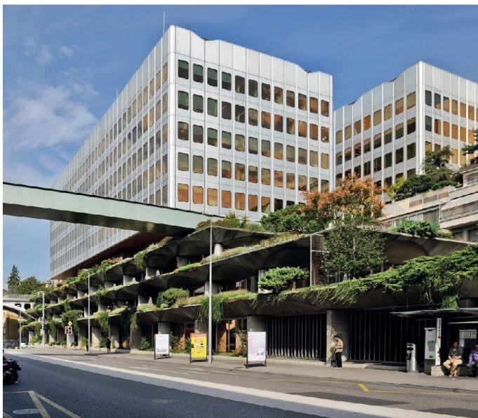
Immeuble Chauderon, Lausanne VD (AAA, Roland Willomet, Paul Dumartheray, 1969–1974)