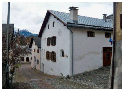
Engadinerhaus, Scuol GR