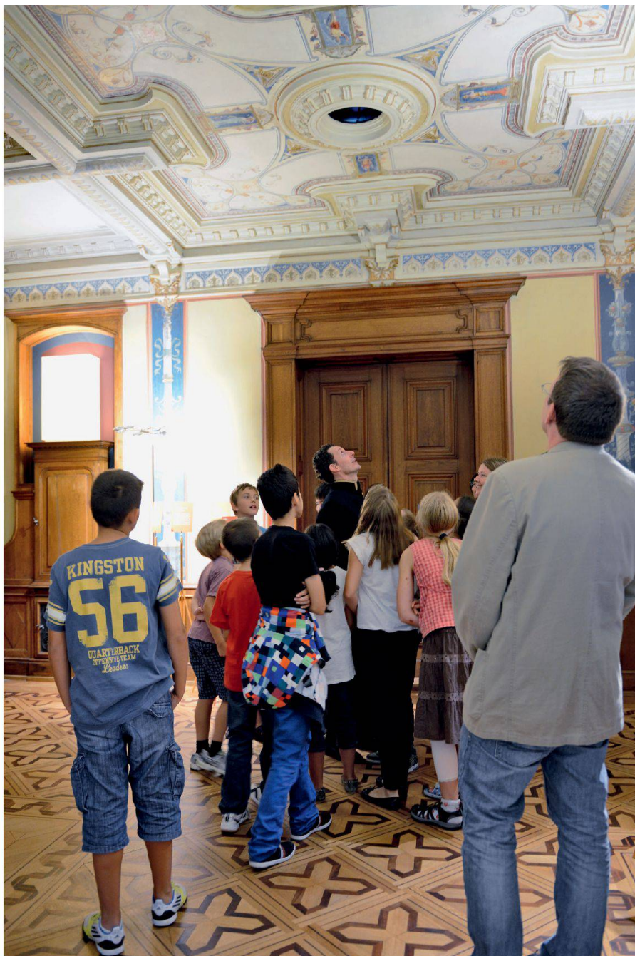
Staunende Besucherinnen und Besucher in der Villa Patumbah Visiteurs émerveillés dans la Villa Patumbah

ständlicher Teil des Vermittlungsstoffes. Ich kann mich gut an eine Waldwoche in der Sekundarschule erinnern. Eine Architekturwoche gab es aber nicht. Der Umgang mit der gebauten Umwelt gehört auch heute noch nicht automatisch zum Unterrichtsstoff. Die Fähigkeit, Baukultur zu diskutieren, wird uns nicht in selbstverständlicher Weise gelehrt. Das neue Heimatschutzzentrum füllt hier eine wichtige Lücke. Es hat einen dringenden Auftrag. Das Zentrum soll Kindern und Jugendlichen den Zugang zur Baukultur ermöglichen und erleichtern. Es ist ein seit Langem nötiger Baustein für eine höhere Sensibilität der nächsten Generationen gegenüber baukulturellen Fragen. Dem Bundesamt für Kultur ist die Verbes-