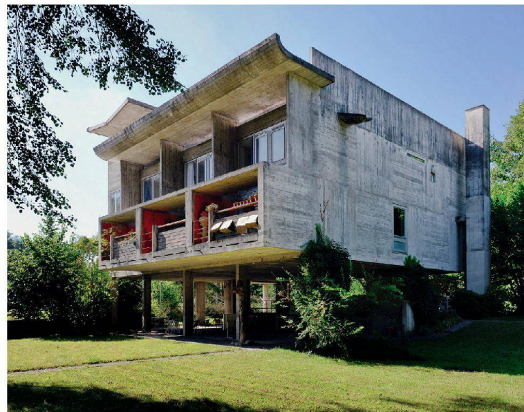
Wohnsiedlung Flamatt II, Flamatt FR (Atelier 5, 1960–1961)