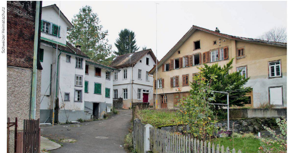
Die Gebäude im Perimeter des Gestaltungsplans «Dorfbach Schwyz» Les bâtiments dans le périmètre du plan d'aménagement «Dorfbach Schwyz»

Der Schwyzer Regierungsrat hat entschieden, dass die Grundeigentümer das Dorfbach-Quartier massiv umgestalten dürfen. Obwohl ein konkretes Kaufangebot vorliegt, sollen weite Teile der historischen Bausubstanz zerstört werden. Erhalten bleiben einzig einige Teile, die der einst ausgestellt werden sollen. Diese leichtfertige Zerstörung eines Kulturguts von nationaler Bedeutung ist für den Schweizer Heimatschutz unverständlich. Dem Kanton Schwyz, der Eigentümerschaft sowie dem Schweizer Heimatschutz