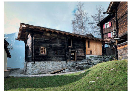
Huberhaus, Bellwald VS