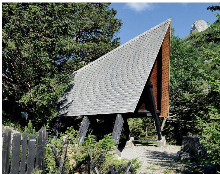
Kapelle St. Bernhard, Bollenwees, Rüte AI (Markus Bollhalder, 1973)