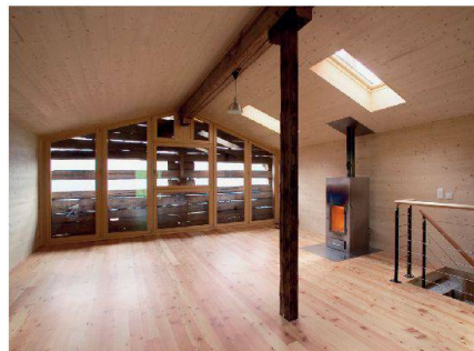
Scheune, Beatenberg BE