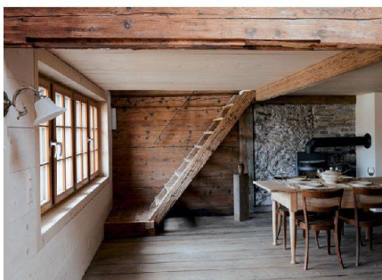
Bödéli-Huus, Bönigen bei Interlaken BE