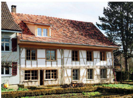
Chatzerüti Hof, Hefenhofen TG (ab 2014 – dès 2014)