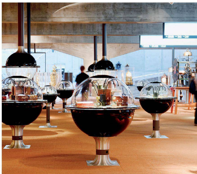
Musée d'horlogerie, La Chaux-de-Fonds NE (Pierre Zoelly, Georges-Jacques Haefeli, 1972–1974)