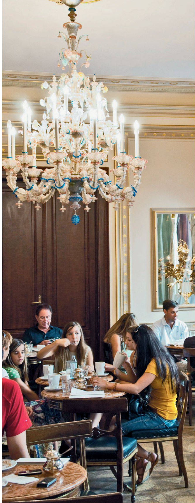
E. Wipha, Keystone