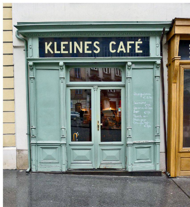
Oliver L. Schreiber

l'ensemble de ces objets, le service de la conservation des monuments a déclassé les intérieurs des Cafés Hawelka et Museum. Dans les faubourgs, le Café Ritter est en cours de protection, et le Café Prückel est protégé depuis 2005. En raison de son extrême simplicité, le plus récent des 2690 cafés de la ville, le « Kleines Café » construit en 1970 dans le style sobre d'Adolf Loos, est certainement le témoin le plus remarquable, mais néanmoins discret, des cafés viennois.