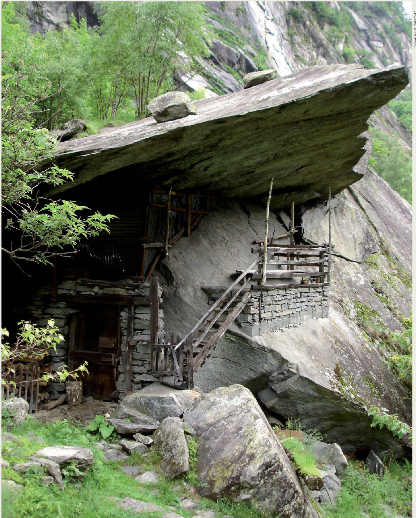
Seit 1994 unterstützt der Schweizer Heimatschutz aus seinem Legat Rosbaud die Fondazione Valle Bavona und die Umsetzung verschiedener Projekte im Tessiner Valle Bavona grosszügig.