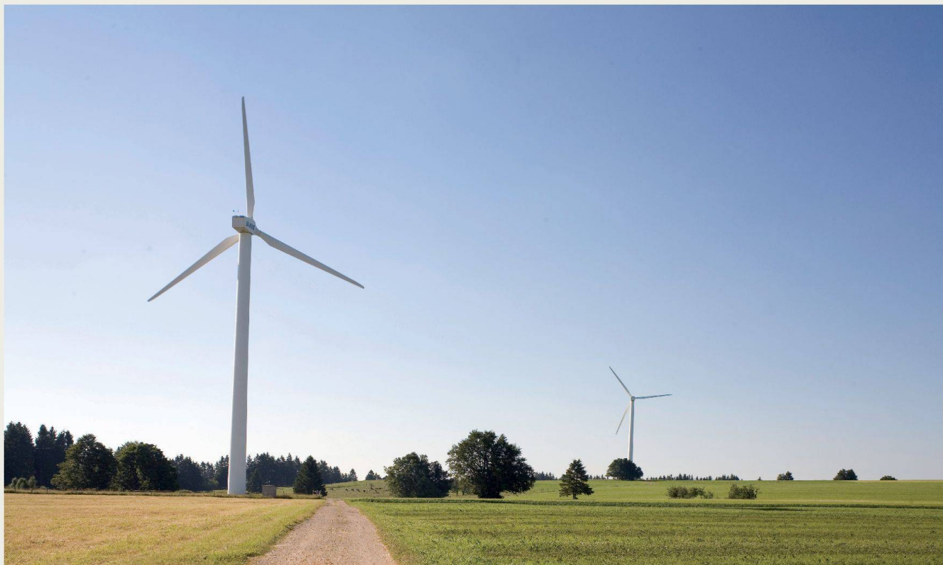
Dans sa prise de position, Patrimoine suisse explique son positionnement sur les installations éoliennes et récapitule les critères à observer dès le stade de la planification de telles installations afin d'optimiser leur intégration dans l'environnement.