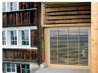
Gais AR, Luser. Im Raum zwischen Wohn- und Stallteil ist eine grosse Öffnung in der Aussenwand möglich.