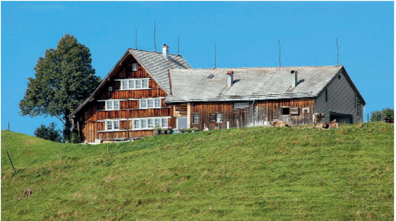
Gais AR, Luser. Umbau 2003 durch Paul Knill, Herisau.