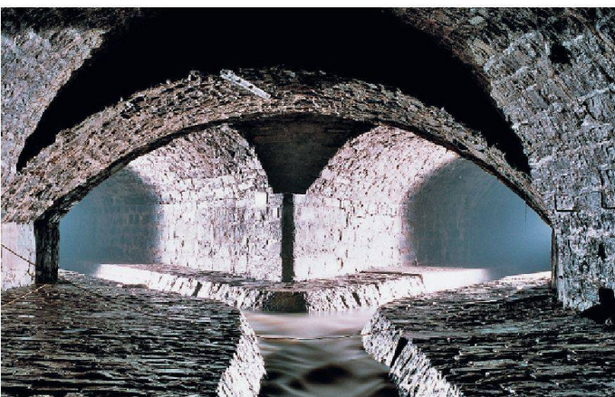
Les journées du patrimoine: l'occasion de visiter le Voûtage du Flon à Lausanne.

L'association Wikimedia CH, qui assure la promotion en Suisse des projets Wikimedia tels que l'encyclopédie en ligne Wikipédia, propose de participer à un concours photo consacré au patrimoine culturel suisse. Le but de ce concours est de prendre, du 1 er juillet au 30 septembre 2011, un maximum de photos des objets référencés comme biens culturels d'importance nationale en Suisse. Toutes les photos seront chargées sur Wikimedia Commons sous licence libre pour être facilement utilisables par la suite. Wikimedia