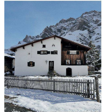
Das Untere Turrahus zuhinterst im Safiental GR.

Informationen und Reservationen: www.magnificasa.ch .