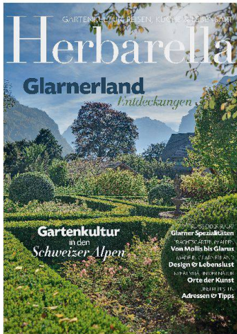
Das Magazin «Herbarella» entdeckt das Glarnerland.