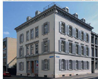
Drei prämierte Basler Bauten: das «Volta-Zentrum», der Spiesshof und das Haus Leonhardsstrasse 37.