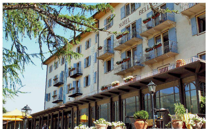
Hôtel Bella Tola de Saint-Luc: la section Valais romand demande de soutenir la restauration du plafond de la salle à manger.

www.heimatschutz-zh.ch ; www.heimatschutzstadtzh.ch