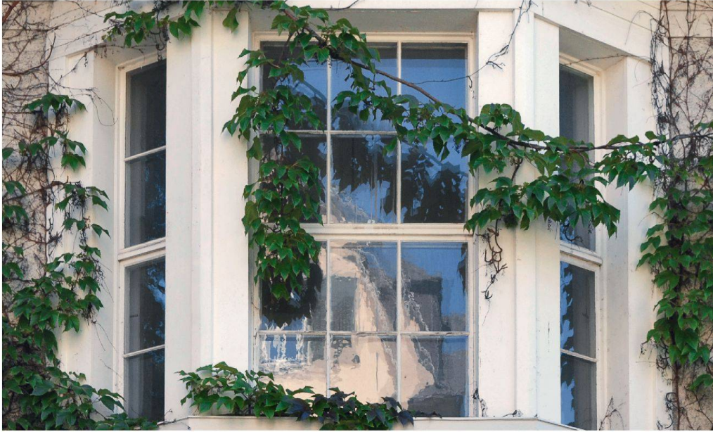
Originalfenster sind ein wichtiger Bestandteil der Bauten aus dem späten 19. und frühen 20. Jahrhundert.