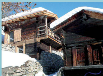
Stallscheune — Niederwald (VS)