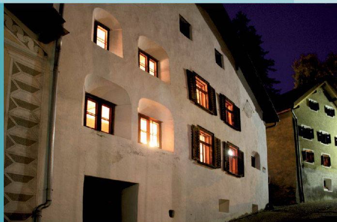
Engadinerhaus — Scuol (GR)

Découvrez d'autres maisons hors du commun sur www.magnificasa.ch .