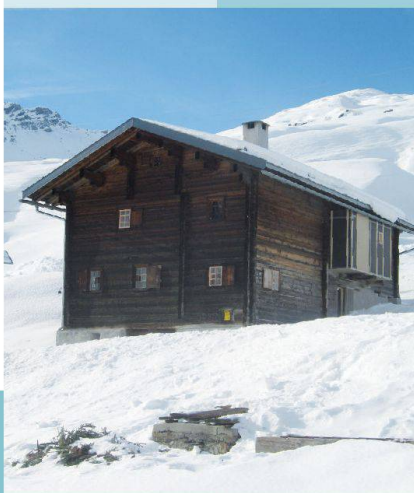
Nüw Hus — Safiental (GR)

Unter www.magnificasa.ch finden Sie weitere aussergewöhnliche Häuser.