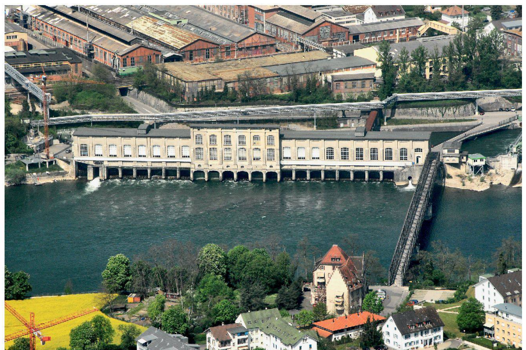
Das alte Kraftwerk Rheinfelden, Schrägluftbild, 2007.

Mehr dazu: www.heimatschutz-ag.ch und www.ig-pro-steg.com .