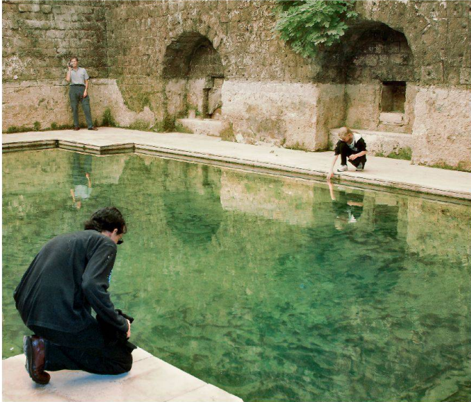
Les thermes d'Allianio en Turquie.