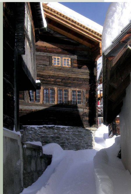
Huberhaus — Bellwald (VS)

Optez pour des vacances au cœur du patrimoine!