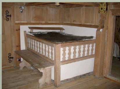
Walserhaus — Safiental (GR)