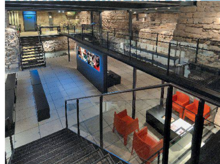
Die mit dem Europa-Nostra-Preis 2008 ausgezeichnete archäologische Fundstelle der Kathedrale Saint-Pierre in Genf

Europa Nostra zeichnet im Auftrag der Europäischen Union jährlich vorbildliche Arbeiten im Zusammenhang mit der Erhaltung des europäischen Kulturerbes aus. Der Preis soll den Wissens- und Erfahrungsaustausch unter den verschiedenen Ländern stimulieren und eine breite Öffentlichkeit auf das vielfältige wertvolle Kulturgut Europas hinweisen.