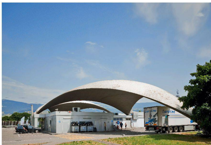
Die Kuppeldächer der Autobahnraststätte Deitingen-Süd blieben erhalten. Die Denkmalpflege stellte die sogenannten Isler-Schalen 1999 unter Schutz.